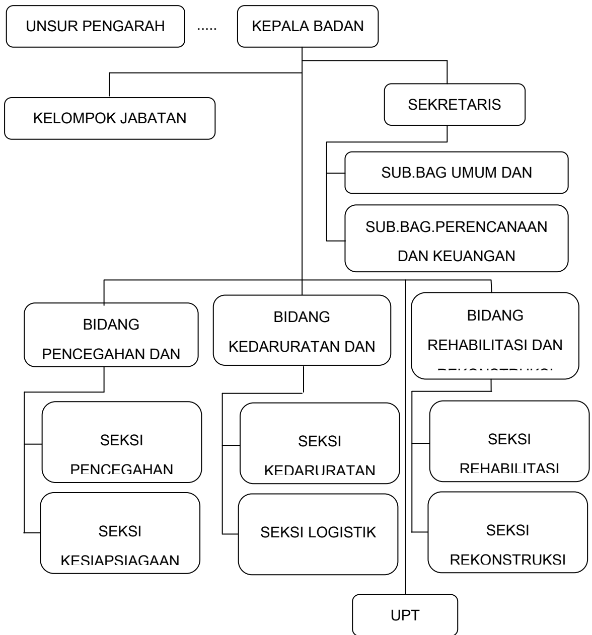
Gambar: 2.1 BAGAN STRUKTUR ORGANISASI BADAN PENANGGULANGAN BENCANA DAERAH