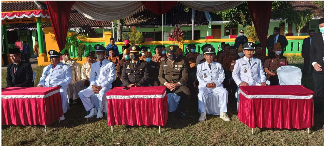
Penyelenggaraan Upacara HUT Kemerdekaan RI