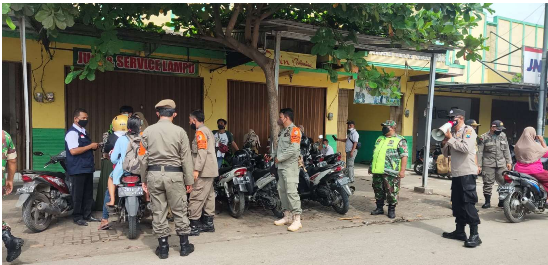
Pol PP Bersama Polsek dan Koramil dalam rangka penertiban