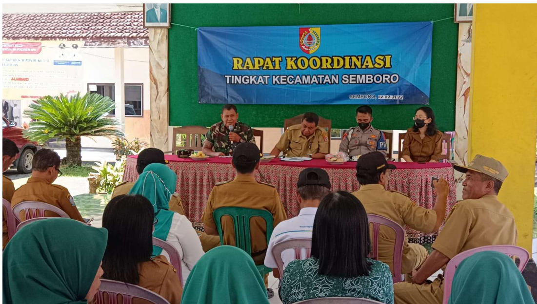
Rapat Koordinasi Tingkat Kecamatan