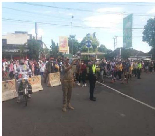
Kegiatan Pengamanan Pelaksanaan kegiatan pada seksi Ketentraman dan Ketertiban di Kecamatan Patrang