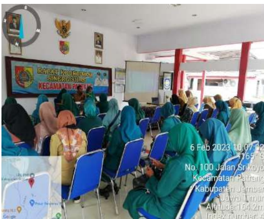
Kegiatan Pemberdayaan PKK dan Pemberian Bantuan pada seksi Pemberdayaan Masyarakat dan Kesejahteraan Sosial di Kecamatan Patrang