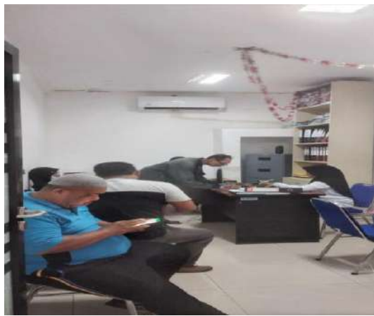
Kegiatan Pelayanan Pengajuan Waris dan Surat Keterangan Lainnya pada seksi Pemerintahan di Kecamatan Patrang