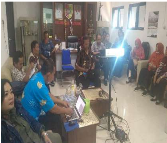
Kegiatan pelayanan administrasi kepegawaian pada subbag Umum dan Kepegawaian di Kecamatan Patrang