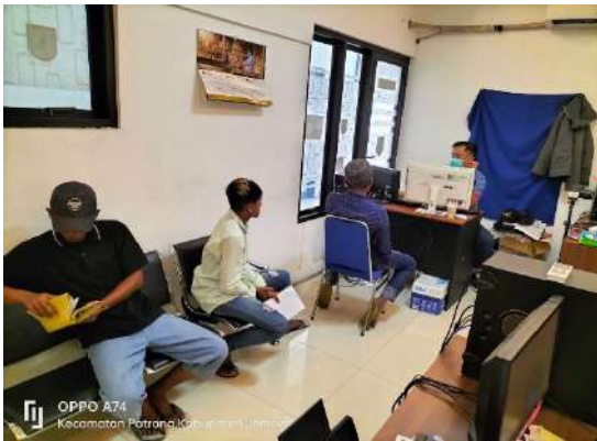
Kegiatan pelayanan administrasi kependudukan pada seksi Pelayanan Umum di Kecamatan Patrang