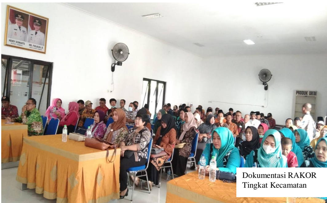
Foto (1-3 foto pelaksanaan sub kegiatan) dan Penjelasan Sub Kegiatan