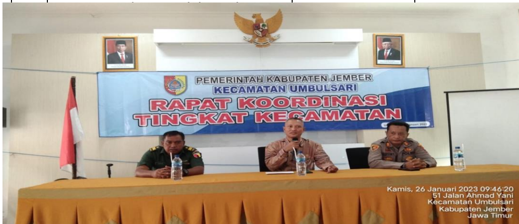
Dokumentasi RAKOR Tingkat Kecamatan