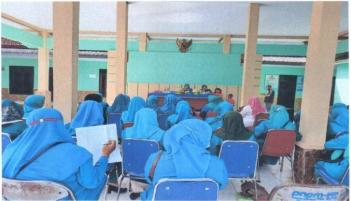
Kegiatan PKK Tingkat Kecamatan