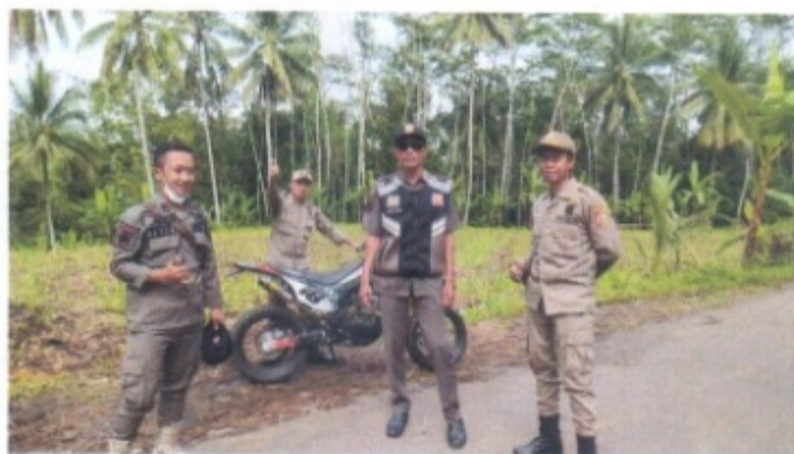
Pam Kegiatan Kunjungan Bupati