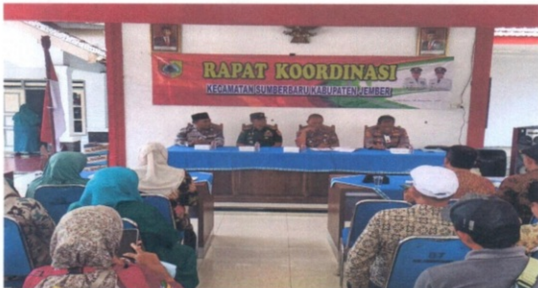
Rapat Koordinasi Tingkat Kecamatan