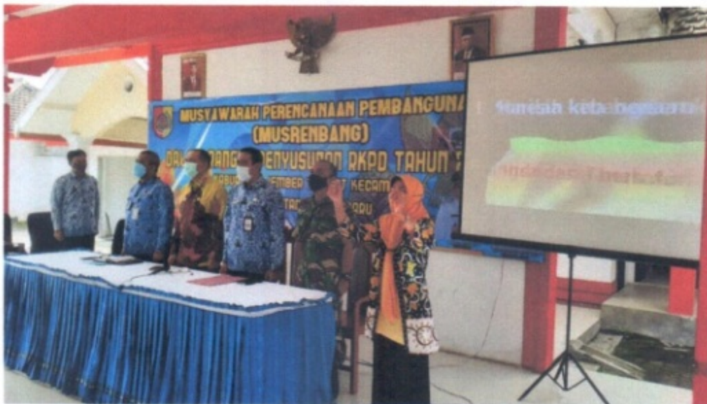
Pelaksanaan Musrenbangkec tahun 2023