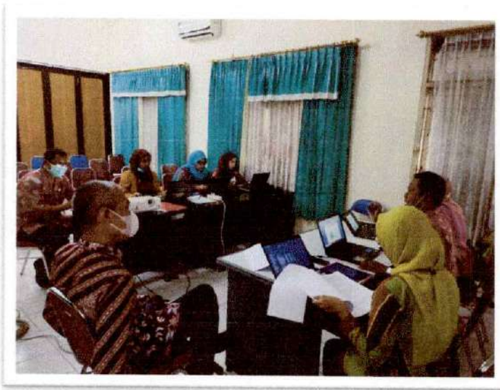
Audit Kinerja Dinas Sosial