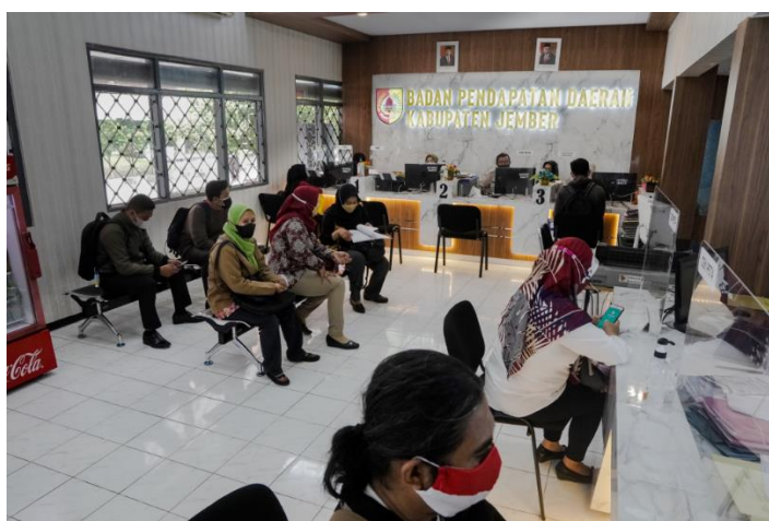
Pelayanan dan Konsultasi Pajak Daerah (Pelaksanaan pelayanan terhadap wajib pajak)