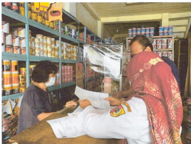
Penagihan Pajak Daerah (Pelaksanaan penagihan Pajak Reklame dan Pajak Air tanah)

Sasaran Strategis 2 : Meningkatnya Kualitas pelayanan Pajak Daerah