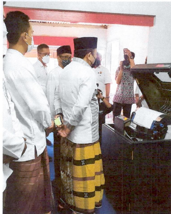
Penetapan Wajib Pajak Daerah (Pelaksanaan proses cetak massal SPPT dan DHKP PBB P2 Tahun 2022 yang disaksikan oleh Bupati Jember)