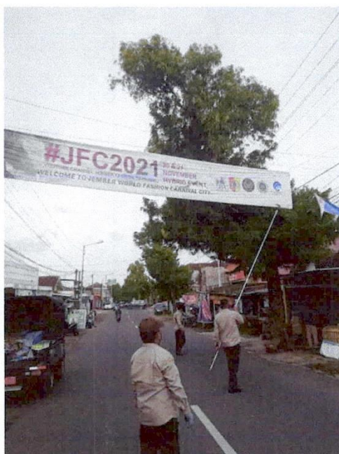
Pengendalian, Pemeriksaan dan Pengawasan Pajak Daerah (Penertiban terhadap reklame insidental yang tidak berijin dan habis masa berlakunya di wilayah Kabupaten Jember)