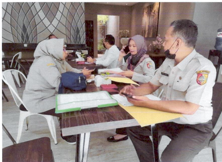
Pembinaan dan Pengawasan Pengelolaan Retribusi Daerah (Pelaksanaan pengendalian dan evaluasi Pajak Hotel, Restoran, Hiburan dan Pajak Parkir serta pemasangan fasilitas aplikasi Laporan Pajak Online Harian)