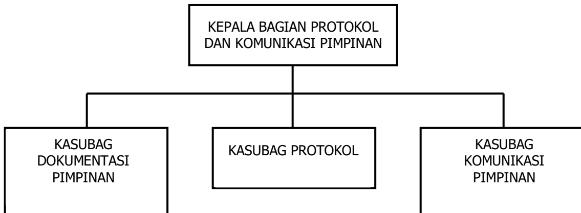
Gambar 1.2 Struktur Organisasi Bagian Protokol dan Komunikasi Pimpinan Sekretariat Daerah Kabupaten Jember