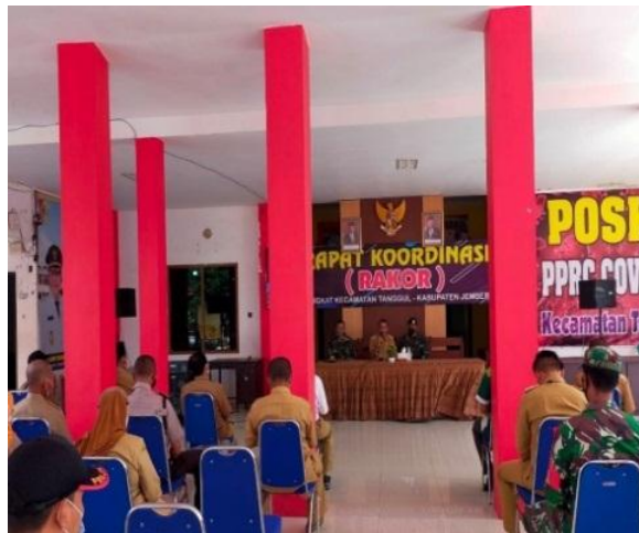
FOTO : PELAKSANAAN KEGIATAN RAPAT KOORDINASI KECAMATAN

Dengan demikian Capaian Kinerja kegiatan Rakor Tingkat Kecamatan sebanyak 89 % termasuk Kategori A dan Interpretasi Memuaskan