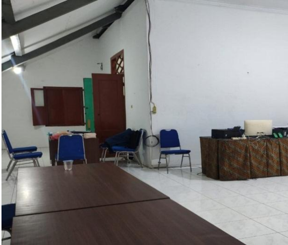
FOTO KEGIATAN PEMELIHARAAN GEDUNG KANTOR