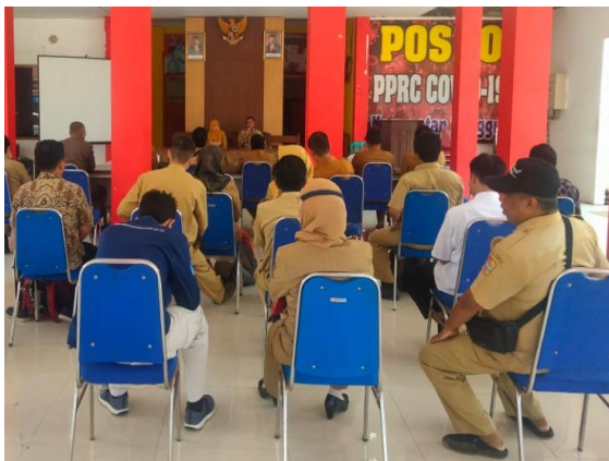
FOTO KEGIATAN PENYUSUNAN DOKUMEN PERENCANAAN

Kegiatan Penyusunan Perencanaan Perangkat Daerah bertujuan untuk meningkatkan kualitas pelayanan dengan cara membuat strategi pelayanan aparatur yang bagus sebagai pedoman dalam menjalankan tugas, dengan harapan pelayanan di Kecamatan Tanggul dapat tercapai lebih baik dan bermanfaat bagi masyarakat. Foto diatas merupakan strategi pelayanan yang terdapat pada Dokumen Perencanaan Kecamatan Tanggul.