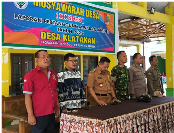
FOTO : KEGIATAN PEMBINAAN TERHADAP PENGELOLAAN KEUANGAN DAN ASET DESA