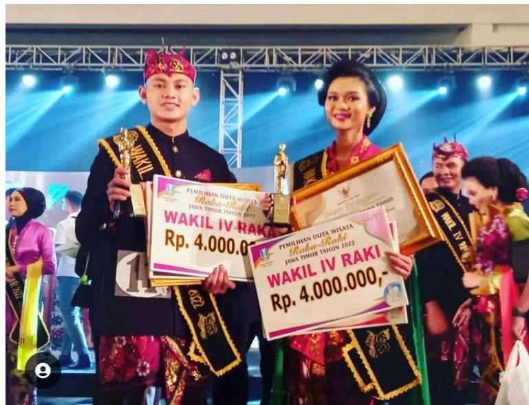
Pemilihan Raka Raki Jawa Timur 2022