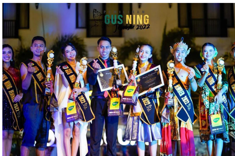
Grand Final Pemilihan Gus dan Ning Jember Tahun 2022