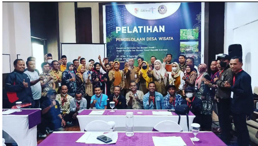
Pemberdayaan Masyarakat dalam Pengelolaan Destinasi Pariwisata Kabupaten/Kota