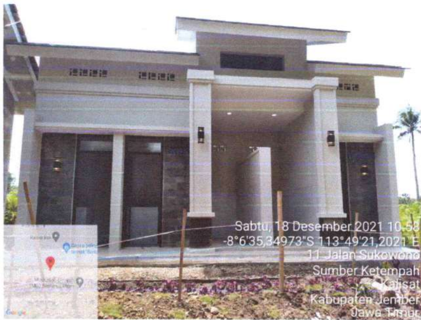
Sabtu, 18 Desember 2021 10:53 8°6'35,34973"S 113°49'21,2021 E 11 Jalan Sukowono Sumber Ketempah Kalisat Kabupaten Jember Jawa Timur