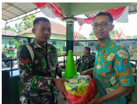
Pemberian bantuan peralatan sepak bola kepada Klub Sepakbola Jember Putra pada tanggal 10 Agustus 2023