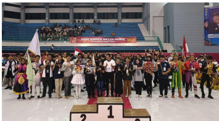
Penutupan Asian Music Games 2023 di GOR PKPSO