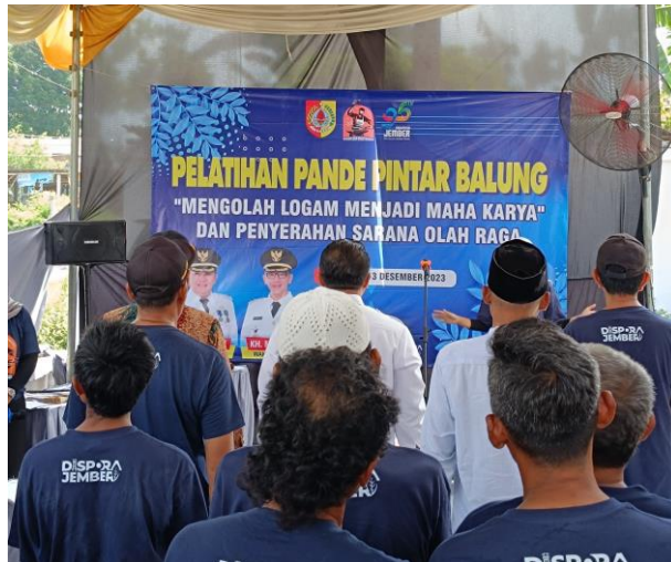
Pelatihan Pemuda pada tanggal 12-13 Desember 2023