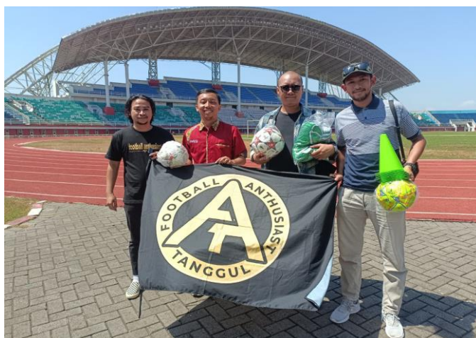
Pemberian bantuan peralatan sepak bola kepada Klub Football Anthusiast Tanggul pada tanggal 10 Agustus 2023