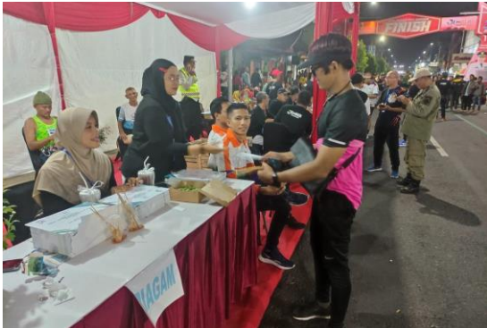
Giati Tajemtra tanggal 25 November 2023