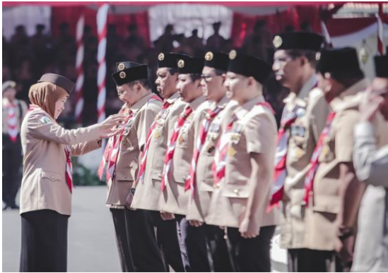
Bupati Jember mendapat penghargaan