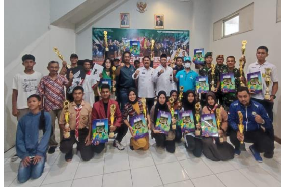
Penyerahan hadiah Tajemtra 2023