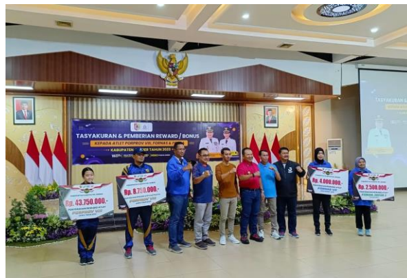
Pemberian Reward Atlet Tahun 2023 di Aula PB. Sudirman tanggal 18 November 2023