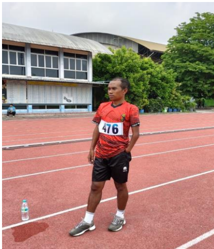
Atlet Paralimpik Kab. Jember