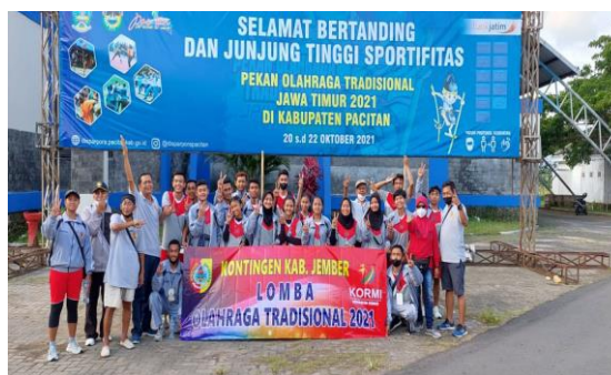
Kontingen PORTRAD Kab. Jember 2021