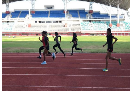
Pelatda cabor atletik di stadion JSG