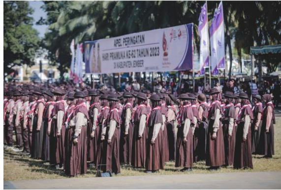
Apel Peringatan Hari Pramuka ke 62