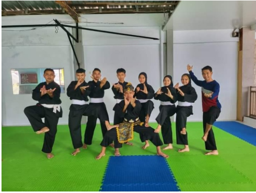
Pelatda cabor pencak silat