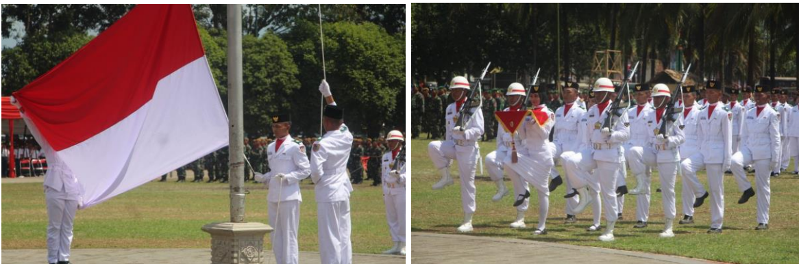
Pengibaran Bendera oleh Paskibra pada tanggal 17 Agustus 2023