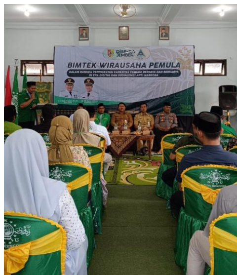
Bimtek Wirausaha Pemula pada tanggal 27-28 November 2023