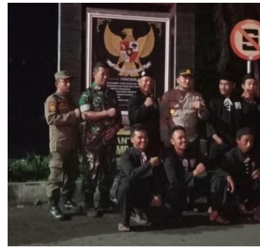
Patroli gabungan yang dilakukan secara rutin antara anggota satpol PP, Polsek dan Koramil Kec. Rambipuji