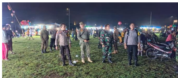
Patroli keliling guna menciptakan keamanan dan ketertiban di wilayah Kecamatan Rambipuji