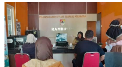
Pelayanan kepada Masyarakat umum yang berkepentingan mengurus adminduk