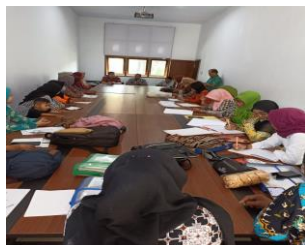
Rapat Koordinasi Persiapan Lomba Admi

Anggaran Sub Kegiatan Peningkatan efektifitas kegiatan pemberdayaan Masyarakat di wilayah kecamatan Rp. 70.693.100,- ( Tujuh puluh juta enam ratus Sembilan puluh tiga ribu seratus rupiah) terealisasi Rp. 69.763.000,- ( Enam puluh Sembilan juta tujuh ratus enam puluh tiga ribu rupiah) atau 98,68%.