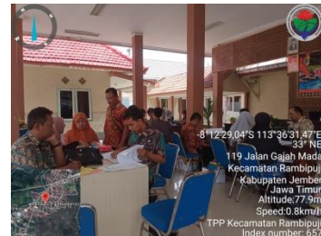
Monitoring dan Evaluasi Inspektorat