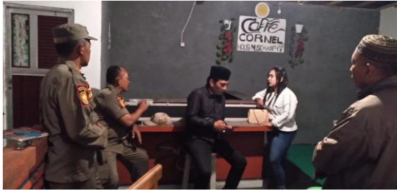
Bersama Perangkat desa menindaklanjuti keluhan masyarakat