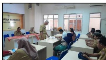
Sosialisai Admindukcapil dan identitas kependudukan digital di aula Kecamatan