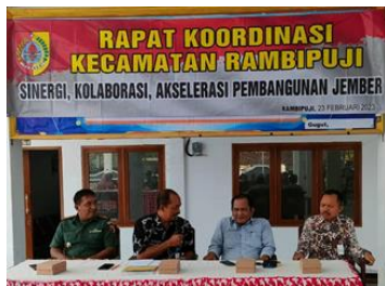
Rakor (Rapat Koordinasi) Camat Bersama Kades Se-Kecamatan Rambipuji

Anggaran Sub Kegiatan Peningkatan efektifitas kegiatan pemerintahan ditingkat kecamatan sebesar Rp. 796.551.000,- (Tujuh ratus Sembilan puluh enam juta lima ratus lima puluh satu ribu rupiah) terealisasi Rp. 795.175.500,- ( Tujuh ratus Sembilan puluh lima juta seratus tujuh puluh lima ribu lima ratus rupiah) atau 99,83%.