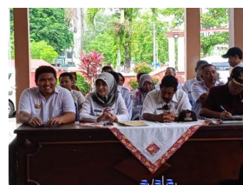
Musrenbang ( Musyawarah Perencanaan Pembangunan)