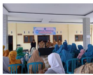
Pembinaan 10 Program Pokok PKK