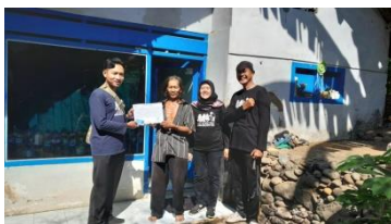
Penyerahan KTP ke desa-desa

Anggaran Sub Kegiatan Pelaksanaan Urusan Pemerintahan yang Terkait dengan Kewenangan Lain yang Dilimpahkan sebesar Rp. 44.174.500,- (Empat puluh empat juta seratus tujuh puluh empat lima ratus rupiah) terealisasi Rp. 43.935.000,- (Empat puluh tiga juta Sembilan ratus tiga puluh lima ribu rupiah) atau 99,46%.