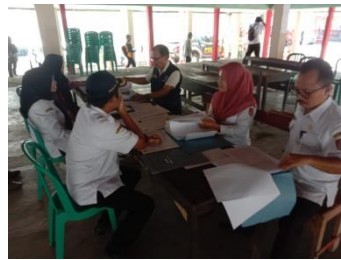
Monitoring dan Evaluasi (monev) TFK