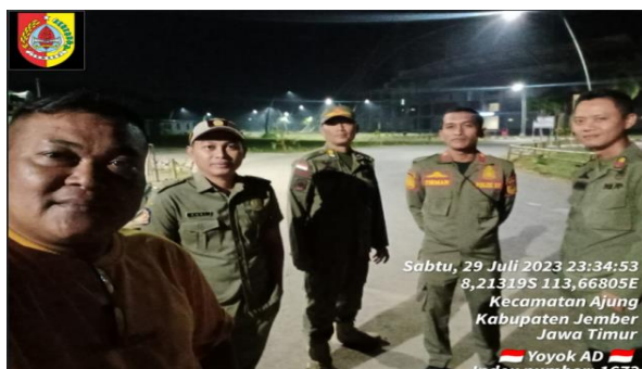
Foto sub kegiatan Sub Kegiatan Koordinasi/Sinergi Dengan Perangkat Daerah yang Tugas dan Fungsinya di Bidang Penegakan Peraturan Perundang-Undangan dan/atau Kepolisian Negara Republik Indonesia sbb :