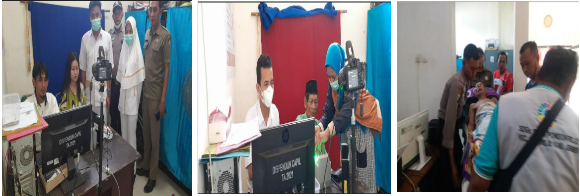
Foto Sub Kegiatan Peningkatan Efektifitas Pelaksanaan Pelayanan Kepada Masyarakat di Wilayah Kecamatan sbb :

Sub Kegiatan Peningkatan Efektifitas Pelaksanaan Pelayanan Kepada Masyarakat di Wilayah Kecamatan. Kegiatan dilaksanakan dalam bentuk Pembayaran Honorarium Tenaga Pelayanan Umum dan belanja makan dan minum koordinasi pelayanan umum, Capaian output mencapai 99,13%, tidak mencapai 100% karena efisiensi.