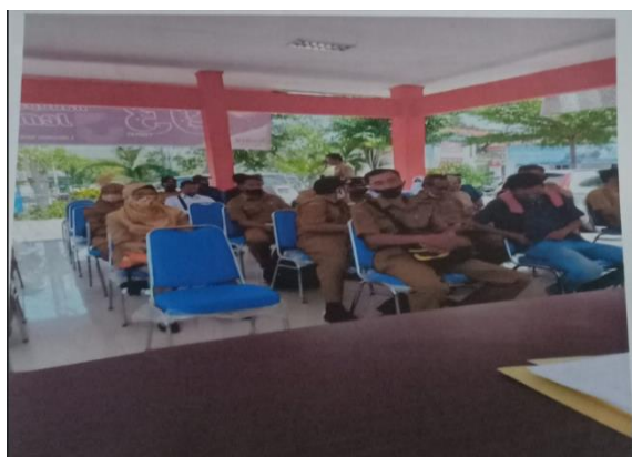
Foto Sub. Kegiatan Peningkatan Partisipasi Masyarakat Dalam Forum Musyawarah Perencanaan Pembangunan di Desa sbb :