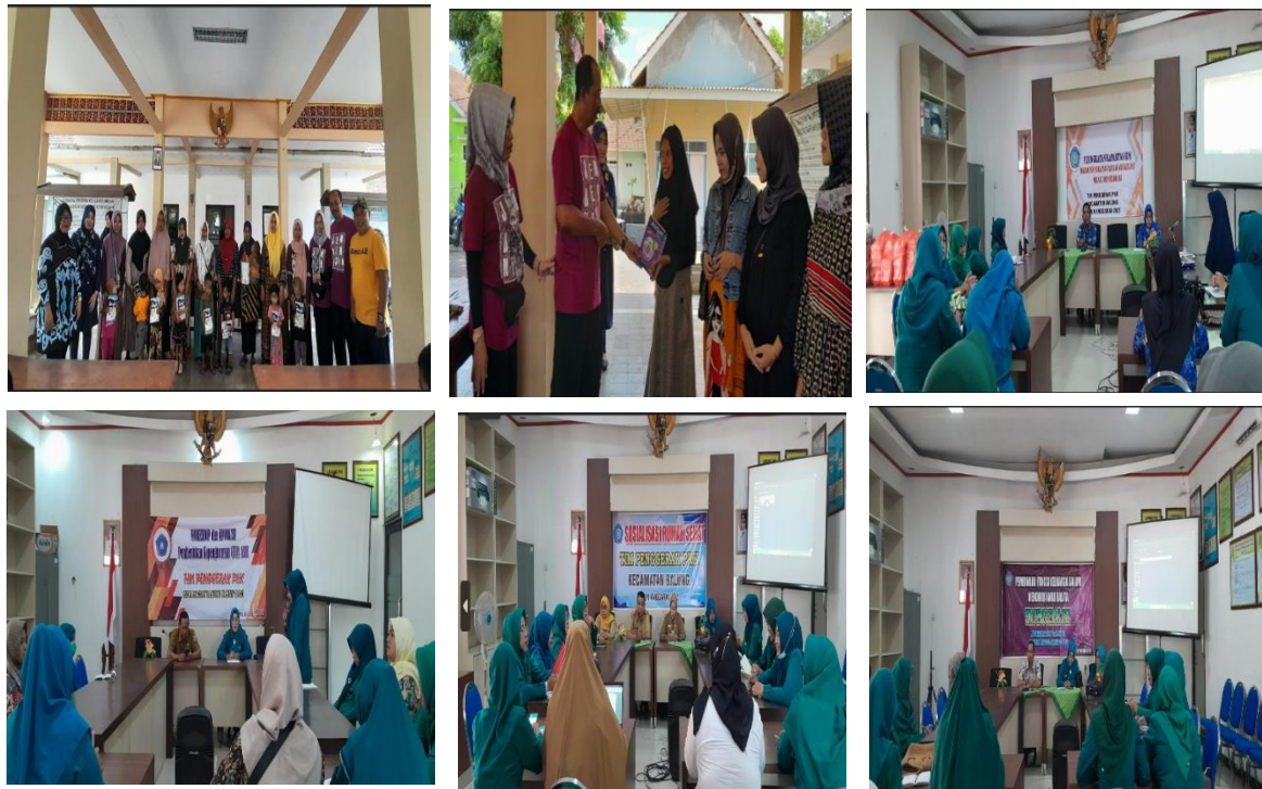
Foto kegiatan Peningkatan Efektifitas Kegiatan Pemberdayaan Masyarakat di Wilayah Kecamatan sbb :

Sub Kegiatan Peningkatan Efektifitas Kegiatan Pemberdayaan Masyarakat di Wilayah Kecamatan. Kegiatan dilaksanakan dalam bentuk Pemberian makanan Tambahan bumil dan balita, Pembinaan fungsi keluarga dalam mendidik anak balita, Peningkatan kapasitas SDM dalam peningkatan capaian ASI eksklusif melalui konselor ASI, Rapat rutin TP. PKK Kec. Balung, Sosialisasi rumah sehat, Penyuluhan AKI, AKB, AKBAL dan Stanting, dan Workshop dan Advokasi pembentukan kepengurusan griya asih. Dalam kegiatan ini capaian output mencapai 97,52%. Capaian tidak mencapai 100% karena efisiensi belanja.