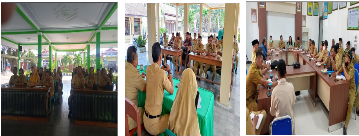
Foto Sub Kegiatan Peningkatan Efektifitas Kegiatan Pemerintahan di Tingkat Kecamatan sbb :

Sub Kegiatan Peningkatan Efektifitas kegiatan pemerintahan di Tingkat Kecamatan. Kegiatan dilaksanakan dalam bentuk rapat Pembinaan perangkat desa dan Pembinaan tertib administrasi desa, dan Pemberian Honorarium RT/RW,