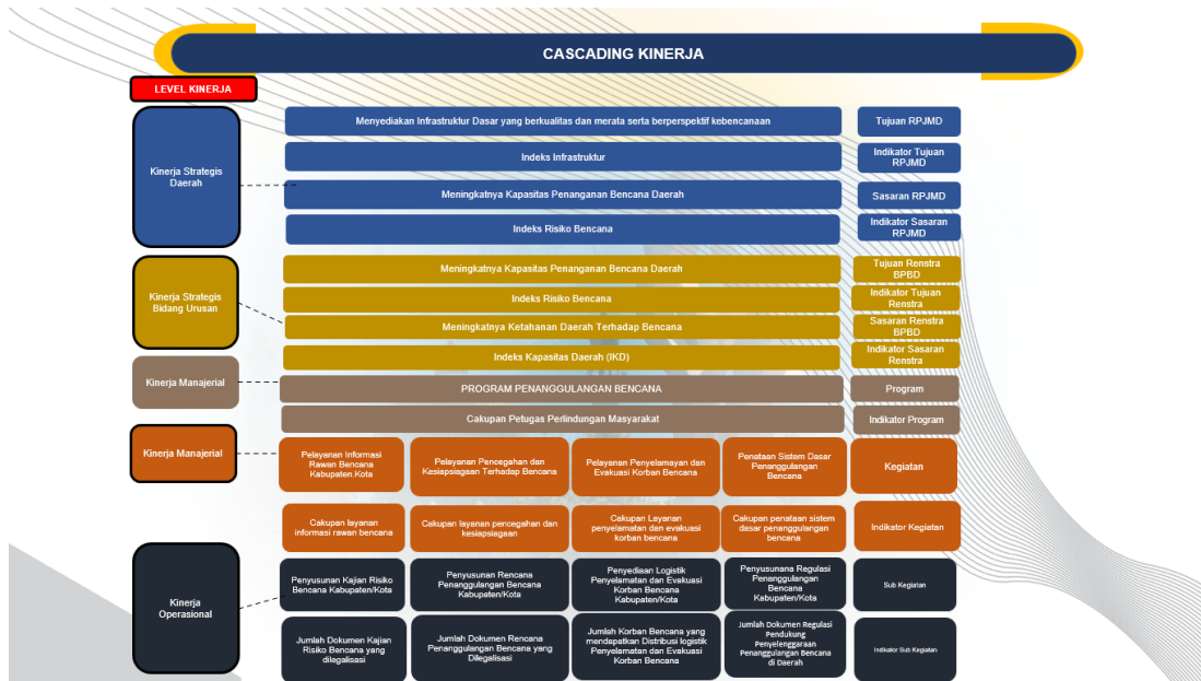
4.2 Cascading Badan Penanggulangan Bencana Daerah Kabupaten Jember