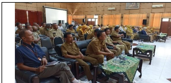
Rapat Koordinasi Pembinaan Karyawan Karyawati Dinas Pendidikan Kabupaten Jember