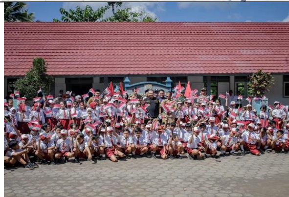
Peresmian Pembangunan Gedung Sekolah SD Tahun 2023