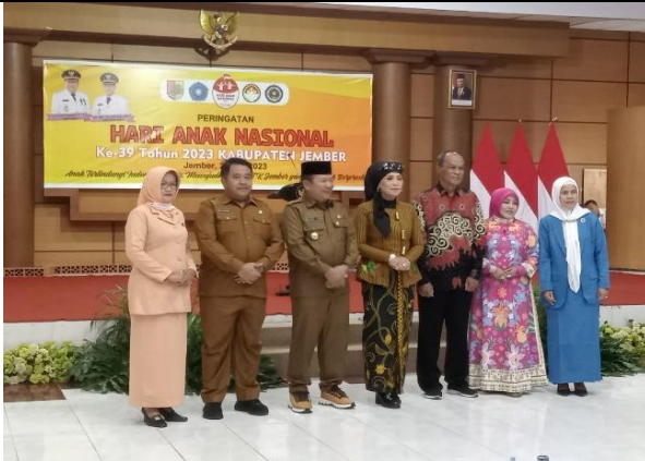
Peringatan Hari Anak Nasional Kabupaten Jember Tahun 2023