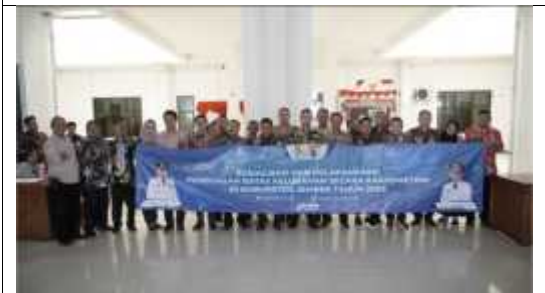
Sosialisasi dan Pelaksanaan Penegasan Batas Kelurahan