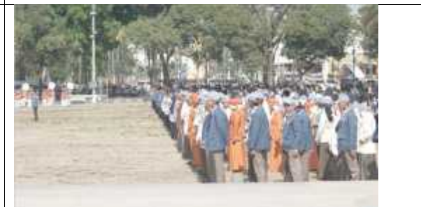
Pelaksanaan HUT Provinsi Jawa timur