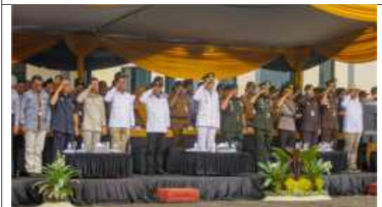
Pelaksanaan HUT Kabupaten Jember