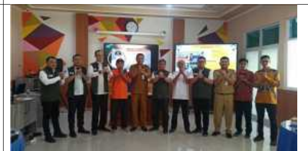
Sinergitas Kinerja Kecamatan