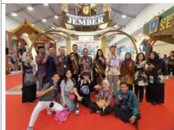
APKASI OTONOMI EXPO 2023