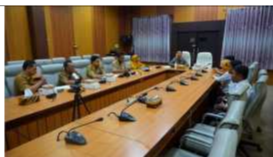
Rapat TTKSD (Tim Koordinasi Kerja Sama Daerah)