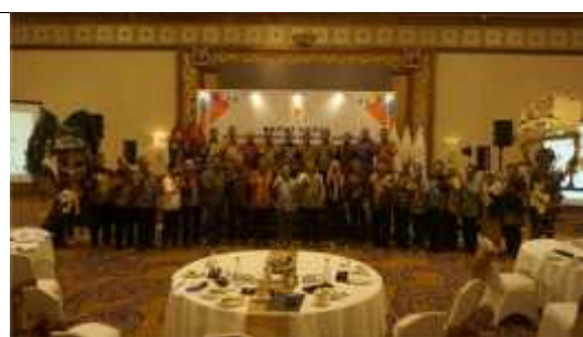
Rapat Kerja APKASI 2023