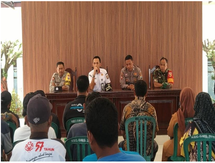
FOTO KEGIATAN KOORDINASI KETENTRAMAN DAN KETERTIBAN UMUM