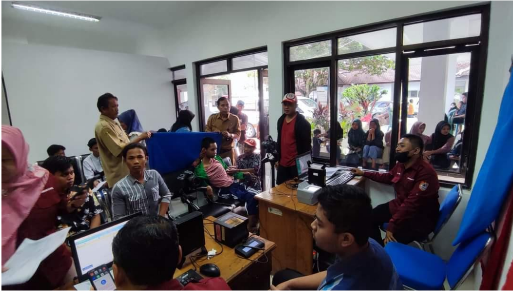
FOTO KEGIATAN PELAYANAN