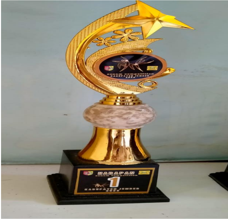
Juara Harapan I Lomba Senam Competition Tahun 2023 Tingkat kabupaten