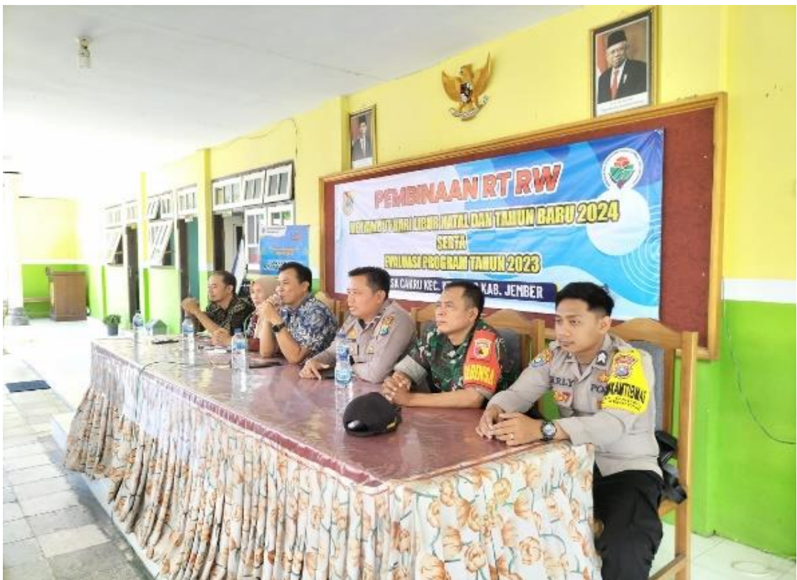
Sub Kegiatan Peningkatan Efektifitas kegiatan pemerintahan di Tingkat Kecamatan. Kegiatan dilaksanakan dalam bentuk rapat Pembinaan perangkat desa dan Pembinaan