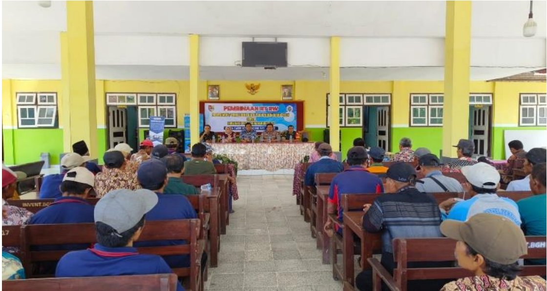
Foto Sub Kegiatan Peningkatan Efektifitas Kegiatan Pemerintahan di Tingkat Kecamatan