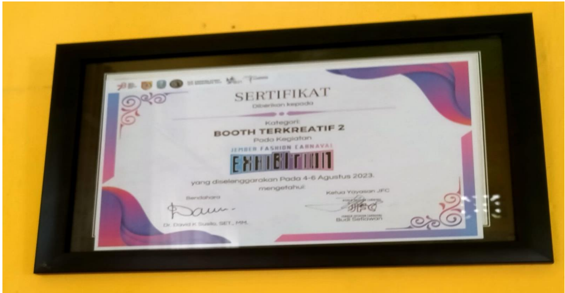
Booth Terkreatif 2 Jember Fashion Carnival EXHIBITION Tahun 2023