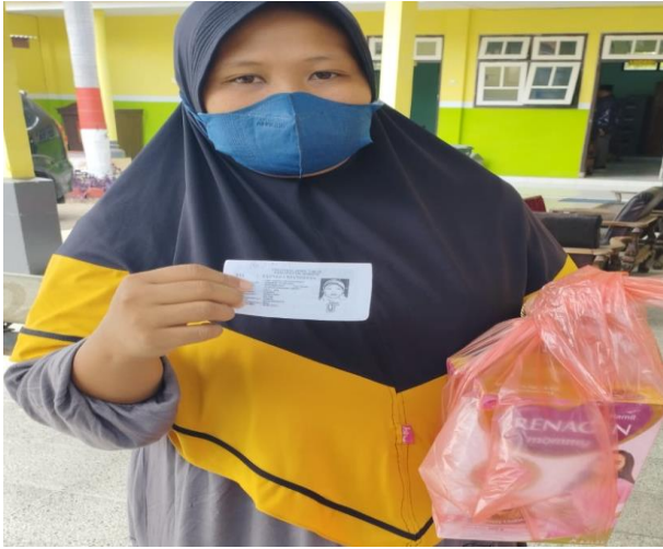
Foto Kegiatan Peningkatan Efektifitas Kegiatan Pemberdayaan Masyarakat di Wilayah Kecamatan