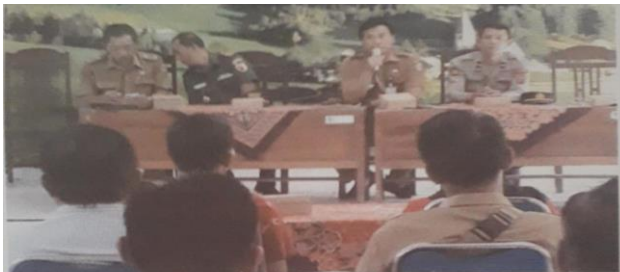
SOSIALISASI DAN PEMBINAAN PEDAGANG KAKI LIMA ALUN-ALUN KENCONG OLEH MUSPIKA KECAMATAN KENCONG TANGGAL 30 MEI 2023