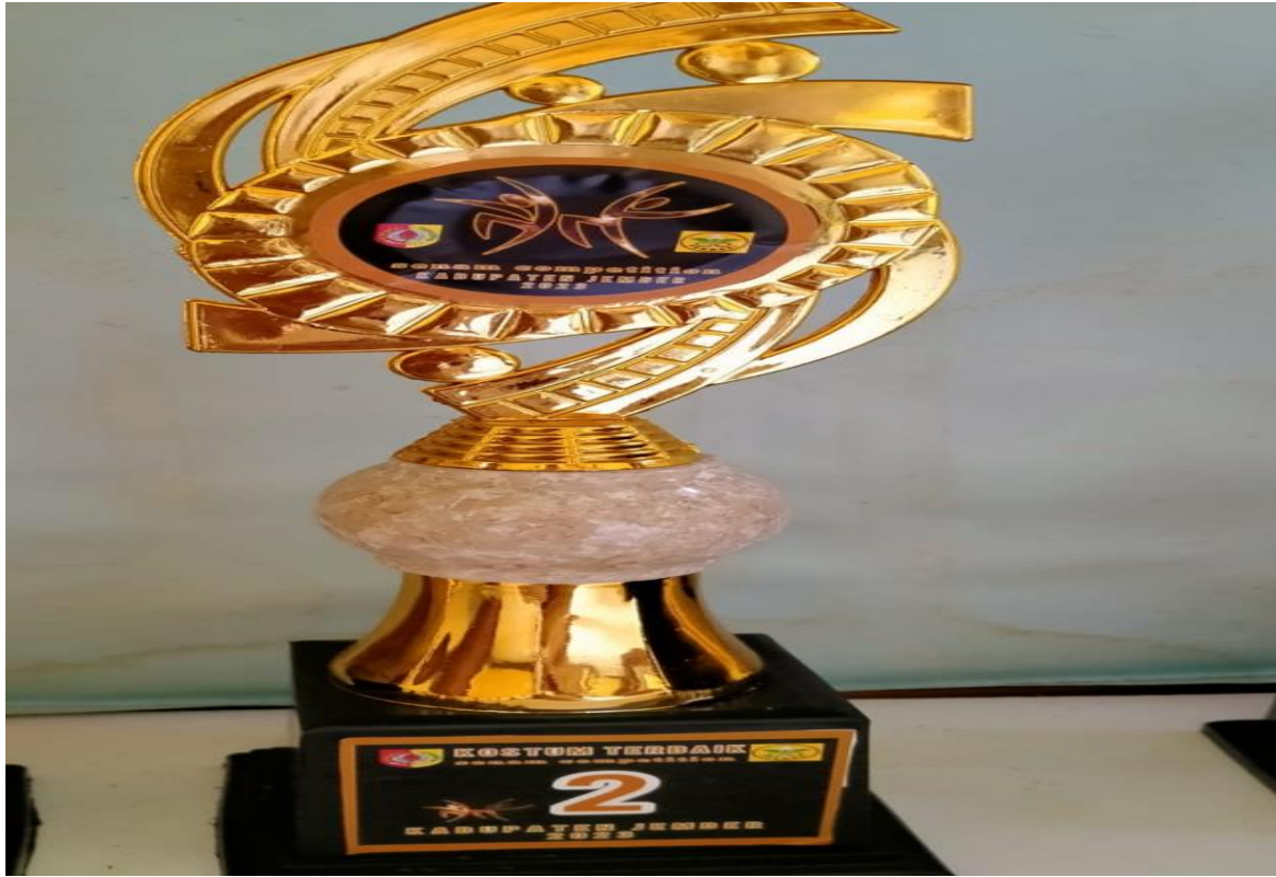
Juara 2 Lomba Kostum Terbaik Senam Competition Tahun 2023