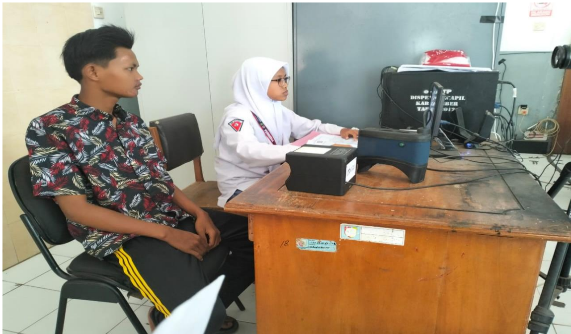
Foto Kegiatan Peningkatan Efektifitas Pelaksanaan Pelayanan kepada Masyarakat di Wilayah Kecamatan

Pembayaran Honorarium Tenaga Pelayanan Umum dan belanja makan dan minum koordinasi pelayanan umum, Capaian output mencapai 99,79%.