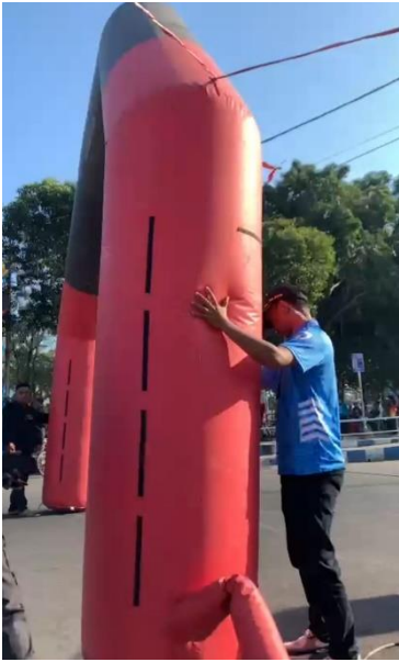
Foto Kegiatan : Pelaksanaan Protokol dan Komunikasi Pimpinan, Sub Kegiatan : Fasilitasi Keprotokolan :