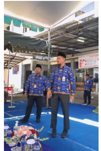
Foto Kegiatan : Pelaksanaan Protokol dan Komunikasi Pimpinan, Sub Kegiatan : Pendokumentasian Tugas Pimpinan :