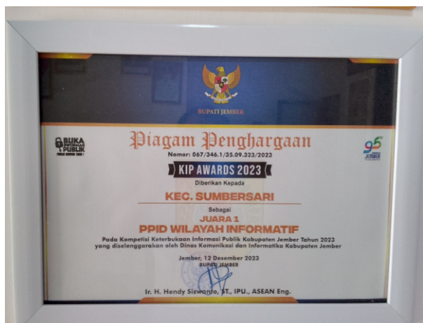
KIP AWARDS 2023