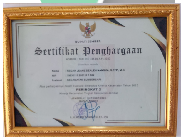
SINERGITAS KINERJA KECAMATAN