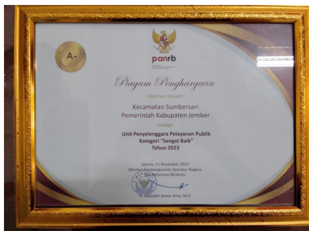
UNIT PENYELENGGARA PELAYANAN PUBLIK KATEGORI "SANGAT BAIK"