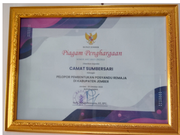
PELOPOR PEMBENTUKAN POSYANDU REMAJA