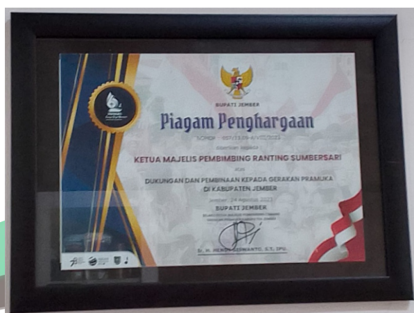
DUKUNGAN DAN PEMBINAAN KEPADA GERAKAN PRAMUKA