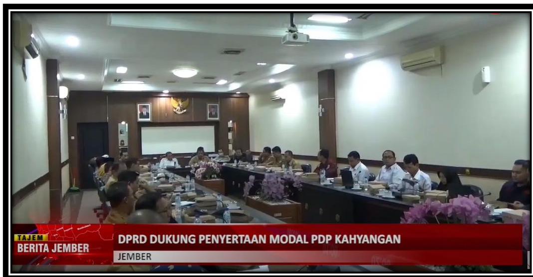
PROSES PEMBAHASAN DAN HARMONISASI SALAH SATU RAPERDA DI KANWILKUMHAM JATIM