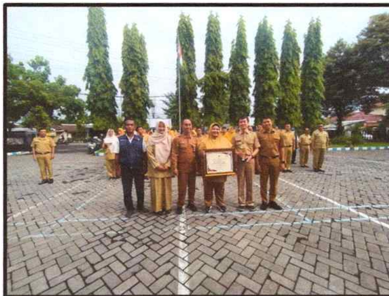
Dokumentasi Penyerahan Penghargaan KIPP dari Kepala Dinas Tanaman Pangan Hortikultura dan Perkebunan Kab. Jember kepada Tim KIPP