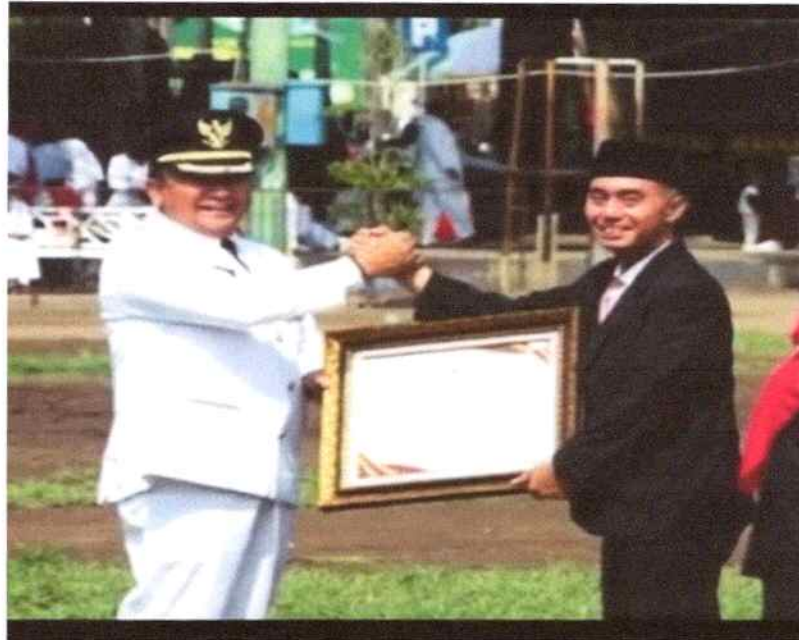
Dokumentasi Penyerahan Penghargaan KIPP dari Bupati Jember kepada Kepala Dinas Tanaman Pangan Hortikultura dan Perkebunan Kab. Jember

berhasil menorehkan prestasi pada Kompetisi Inovasi Pelayanan Publik (KIPP) Kabupaten Jember dengan meraih penghargaan Pengolahan Pupuk Organik untuk inovasi Bio Konversi Maggot Penghasil Pupuk Organik. Inovasi ini dibuat dengan tujuan untuk alternative penyediaan pupuk bagi petani, salah satunya dengan penyediaan pupuk organik bio konversi maggot