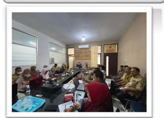
Sistem Pengendalian Intern Pemerintah (SPIP)