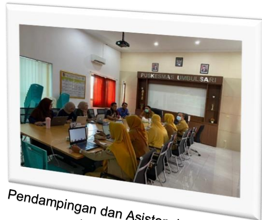
Pendampingan dan Asistensi Zona Integritas di PKM UMBULSARI