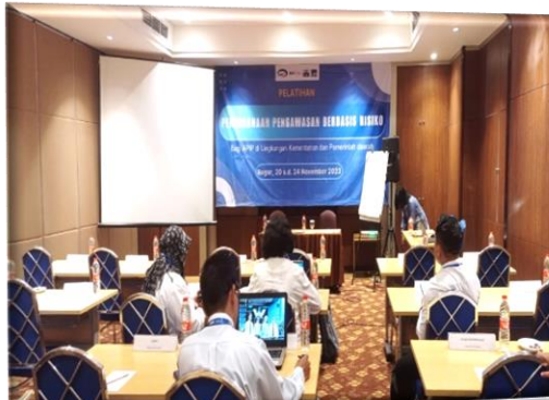
DIKLAT KOMPETENSI PPBR