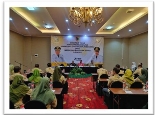
Bimtek Peningkatan Kapabilitas APIP