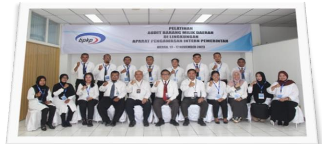
DIKLAT AUDIT BMD