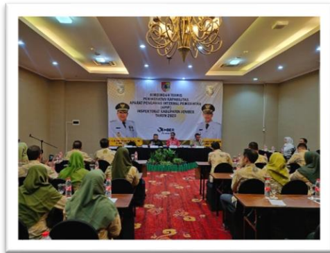
Foto Sub Kegiatan Bimbingan Teknis Implementasi Peraturan Perundang-Undangan