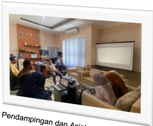
Pendampingan dan Asistensi Zona Integritas di DISPENDUKAPIL