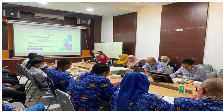
FOTO SUB KEGIATAN 1.3.1 Penelitian dan Pengembangan Lingkungan Hidup