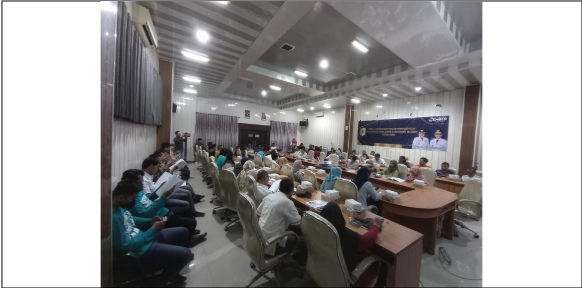
FOTO SUB KEGIATAN Koordinasi Pelaksanaan Forum Perangkat Daerah/Lintas Perangkat Daerah