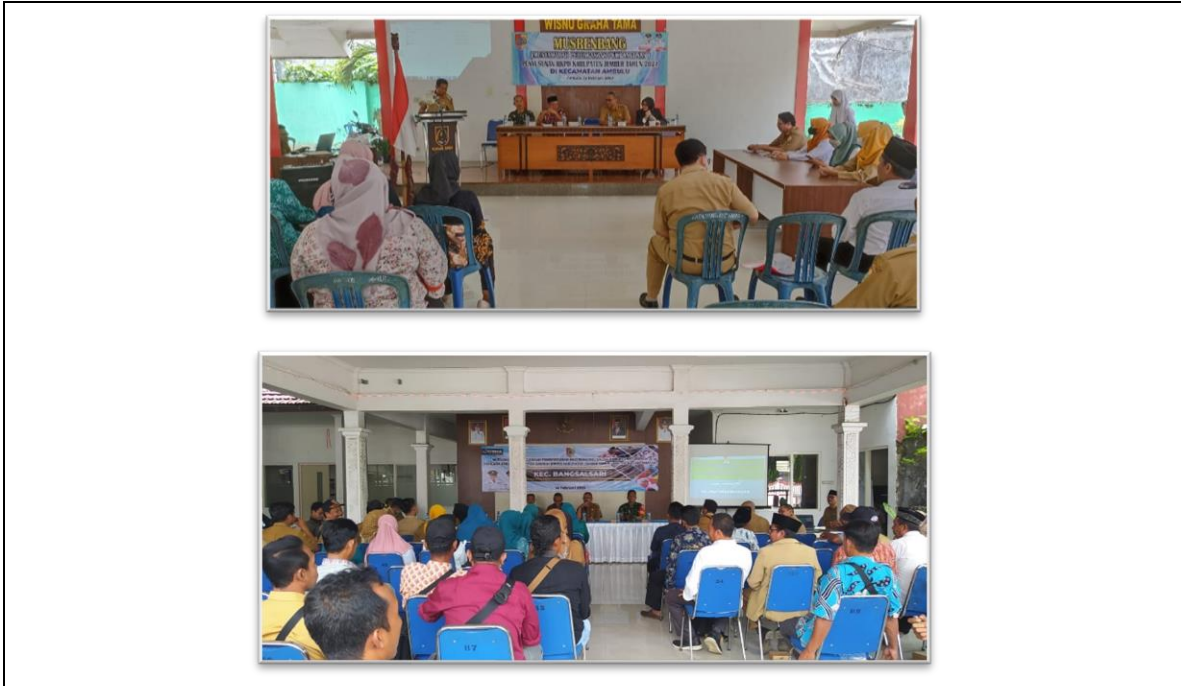
FOTO SUB KEGIATAN Koordinasi Pelaksanaan Forum Perangkat Daerah/Lintas Perangkat Daerah