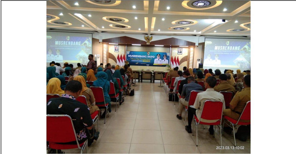
FOTO SUB KEGIATAN Penyiapan Bahan Koordinasi Musrenbang Kecamatan