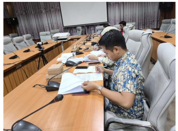
Penandatanganan Berita Acara Batas Wilayah Kelurahan dan Desa