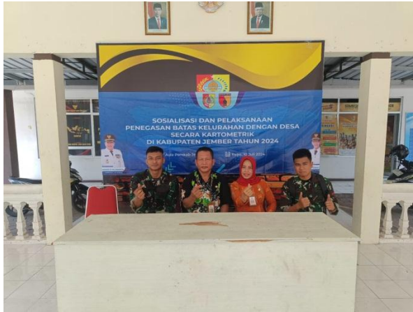
Sosialisasi dan Pelaksanaan Penegasan Batas Kelurahan dengan Desa