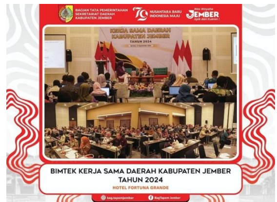
Bimtek Kerja Sama Daerah Kabupaten Jember Tahun 2024