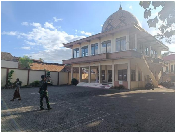
Kegiatan toponimi pada unsur alami, buatan, dan budaya