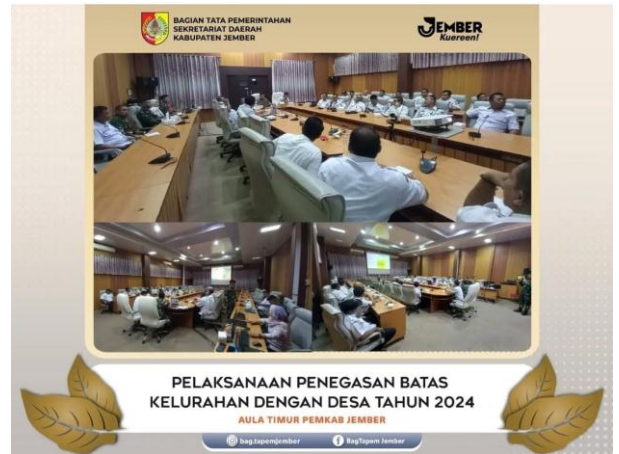
Pelaksanaan Penegasan Batas Kelurahan dengan Desa Tahun 2024