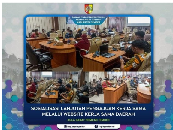
Sosialisasi Lanjutan Pengajuan Kerja Sama melalui Website Kerja Sama Daerah