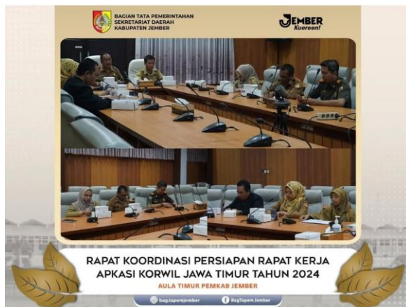
Rapat Koordinasi Persiapan Rapat Kerja APKASI Korwil Jawa Timur Tahun 2024

Pada sub kegiatan Fasilitasi Kerja Sama Dalam Negeri dengan target 50 Dokumen terealisasi 42 dokumen. Sub kegiatan ini juga memfasilitasi kegiatan-kegiatan tersebut diatas yaitu: