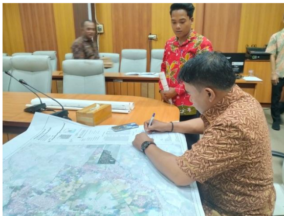
Penandatanganan Peta Batas Wilayah Kelurahan dan Desa