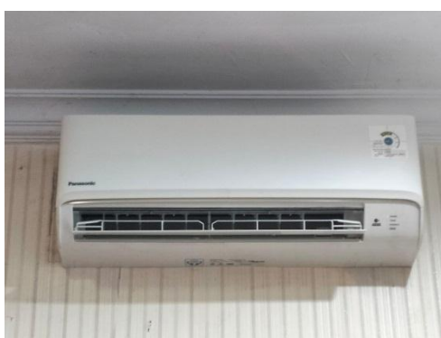
1 Unit AC