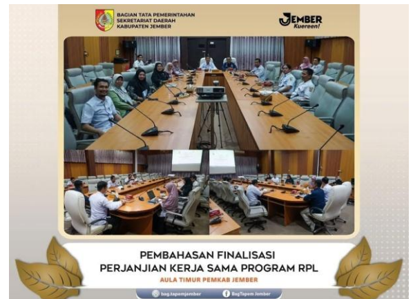
Pembahasan Finalisasi Kerja Sama Program RPL