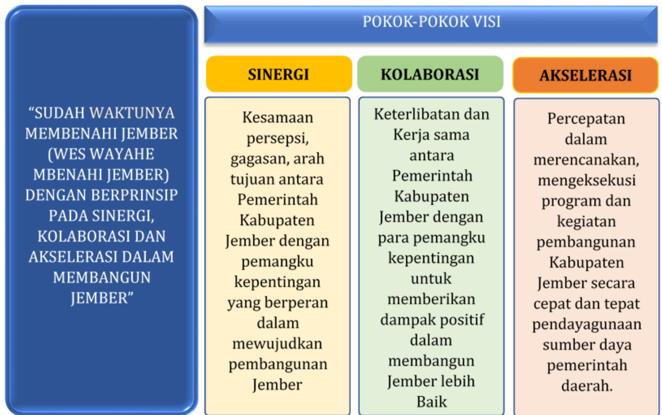
Gambar 3.1 Tiga Pilar utama dalam membangun Jember

Untuk mewujudkan visi pembangunan Kabupaten Jember 5 (lima) tahun kedepan telah ditetapkan 7 (tujuh) misi pembangunan yang akan menjadi acuan dalam pembuatan program dan kegiatan. Adapun ke 7 (tujuh) misi pembangunan tersebut adalah: