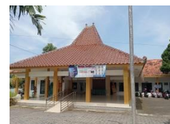
Pemeliharaan Gedung (Pengecatan) pada Kec. Kalisat