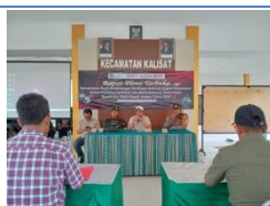
Rapat Pleno Perhitungan Suara Pilkada pada Kecamatan Kalisat