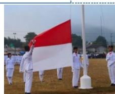
Kegiatan PHBN 2024 pada Kecamatan Kalisat