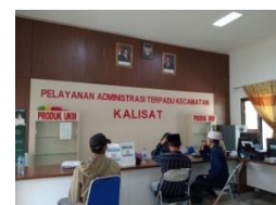
Adminduk di Kecamatan Kalisat