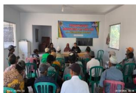
Rakor (Rapat Koordinasi) RTRW se wilayah Kec. Kalisat