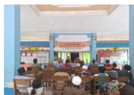
Rapat pembinaan kewilayahan