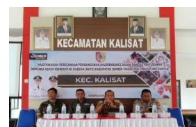
Kegiatan Musrenbang Tingkat Kecamatan dengan Desa dan Lembaga Masyarakat pada Kec. Kalisat