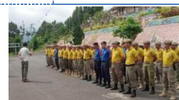
Rakor dengan MAKO terkait kegiatan TAGANA pada Kec. Kalisat