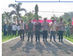
Kegiatan Apel Bersama Persiapan Pilkada pada Kecamatan Kalisat