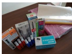
Belanja ATK pada Kecamatan Kalisat