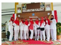
Kegiatan PKK Kecamatan dan Lansia pada Kecamatan Kalisat