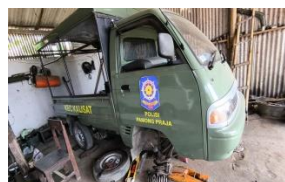
Kegiatan Pemeliharaan Mobil Operasional Kecamatan Kalisat