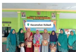
Kegiatan Pembagian PMT oleh TP PKK Kecamatan Kalisat