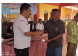
Pembagian Berkas Adminduk melalui RT-RW di Kec. Kalisat