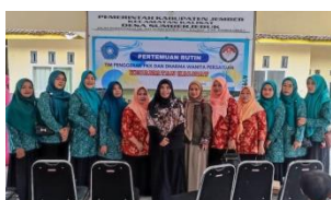
Kegiatan Evaluasi Sosialisasi AKI, AKB dan Stunting pada Kecamatan Kalisat