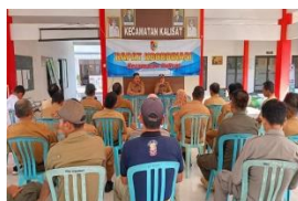
Rapat Koordinasi pada Kecamatan Kalisat