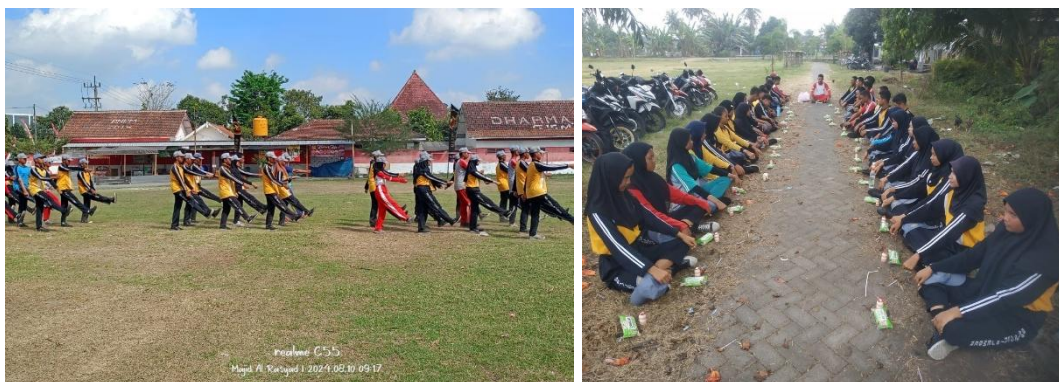
Foto pelatihan paskib, pengukuhan dan upacara bendera dalam rangka HUT RI ke 79

Kegiatan yang dilaksanakan pada Sub Kegiatan Koordinasi/Sinergi dengan Perangkat Daerah yang Tugas dan Fungsinya di Bidang Penegakan Peraturan Perundang-Undangan dan/atau Kepolisian Negara Republik Indonesia adalah penyelenggaraan ketentraman dan ketertiban umum di wilayah kecamatan Semboro, pelatihan paskibra, pengukuhan paskibra, upacara pengibaran bendera merah putih dan upacara penurunan bendera merah putih serta honorarium pol pp sebanyak 11 orang. Target sebesar 12 laporan dan terealisasi 12 laporan sehingga prosentase realisasinya sebesar 100%.