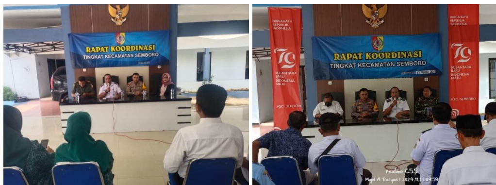
Foto rapat koordinasi tingkat Kecamatan

Kegiatan yang dilaksanakan pada Sub Kegiatan Peningkatan Efektifitas Kegiatan Pemerintahan di Tingkat Kecamatan adalah penyelenggaraan rapat koordinasi tingkat kecamatan sebanyak 12 kali dan honorarium RT dan RW selama 12 bulan. Target sebesar 12 Dokumen dan terealisasi 12 dokumen sehingga prosentase realisasinya sebesar 100%.