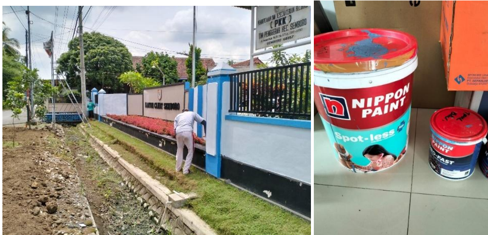
Foto pemeliharaan gedung kantor dan bangunan lainnya

Kegiatan yang dilaksanakan pada Sub Kegiatan Pemeliharaan/Rehabilitasi Gedung Kantor dan Bangunan Lainnya adalah pengecatan gedung kantor dan pagar kantor. Target sebesar 1 unit dan terealisasi 1 unit sehingga prosentase realisasinya sebesar 100%.