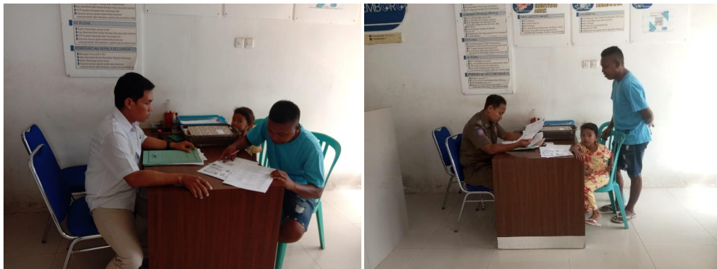
Foto pelayanan umum

Kegiatan yang dilaksanakan pada Sub Kegiatan Pelaksanaan Urusan Pemerintahan yang Terkait dengan Kewenangan Lain yang Dilimpahkan adalah pelayanan terhadap masyarakat yang memerlukan pelayanan selama 12 bulan dan honorarium Tenaga pengadministrasi pelayanan selama 12 bulan. Target sebesar 12 Dokumen dan terealisasi 12 dokumen sehingga prosentase realisasinya sebesar 100%.