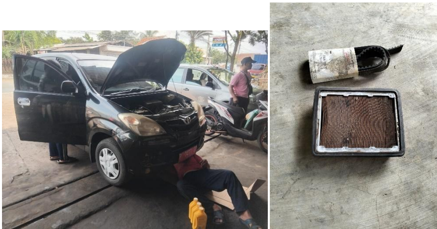
Foto pemeliharaan mobil jabatan

Kegiatan Pemeliharaan Barang Milik Daerah Penunjang Urusan Pemerintahan Daerah