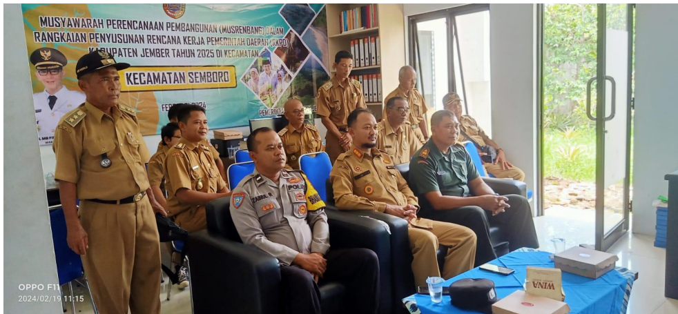
Foto Musrenbang tingkat Kecamatan