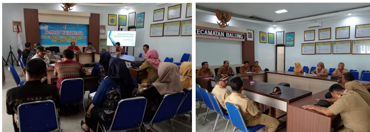
Foto Sub Kegiatan Peningkatan Efektifitas Kegiatan Pemerintahan di Tingkat Kecamatan sbb :

Kegiatan Penyelenggaraan Urusan Pemerintahan yang Tidak Dilaksanakan oleh Unit Kerja Perangkat Daerah yang Ada di Kecamatan