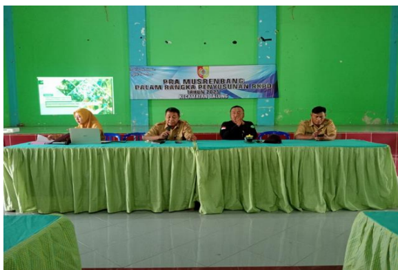
Foto Sub. Kegiatan Peningkatan Partisipasi Masyarakat Dalam Forum Musyawarah Perencanaan Pembangunan di Desa sbb :

Sub Kegiatan Peningkatan Partisipasi Masyarakat Dalam Forum Musyawarah Perencanaan Pembangunan di Desa. Kegiatan dilaksanakan dalam bentuk rapat Pra Musrenbang, Pelaksanaan Musrenbang Tingkat Kecamatan, tujuan dilaksanakannya musrenbang Tingkat Kecamatan untuk Membahas dan menyepakati usulan rencana kegiatan pembangunan lintas desa atau bukan kewenangan desa sesuai DU RKP Desa di wilayah kecamatan. Kegiatan ini capaian realisasi mencapai 84%, tidak mencapai 100% karena efisiensi belanja.