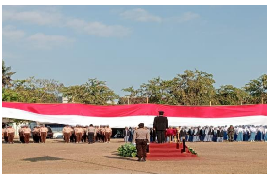
Foto Sub Kegiatan Koordinasi/Sinergi Dengan Perangkat Daerah yang Tugas dan Fungsinya di Bidang Penegakan Peraturan Perundang-Undangan dan/atau Kepolisian Negara Republik Indonesia

Sub Kegiatan Koordinasi/Sinergi Dengan Perangkat Daerah yang Tugas dan Fungsinya di Bidang Penegakan Peraturan Perundang-Undangan dan/atau Kepolisian Negara Republik Indonesia. Kegiatan dilaksanakan dalam bentuk Pembayaran honorarium tenaga Banpol PP dan Peringatan Hari Ulang Tahun Kemerdekaan Republik Indonesia yaitu Upacara HUT RI ke 79. Adapun tujuan dilaksanakannya kegiatan ini untuk memupuk rasa cinta tanah air dengan mengingat perjuangan para pahlawan. Realisasi capaian mencapai 92% Capaian tidak mencapai 100%, karena efisiensi belanja.