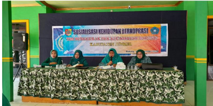
Foto Sub. Kegiatan Peningkatan Efektifitas Kegiatan Pemberdayaan Masyarakat di Wilayah Kecamatan