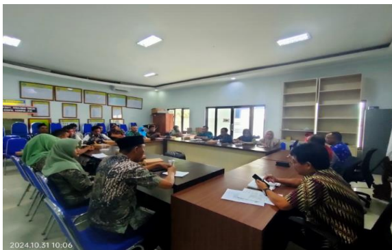
Foto Sub Kegiatan Peningkatan Efektifitas Pelaksanaan Pelayanan Kepada Masyarakat di Wilayah Kecamatan sbb :

Sub Kegiatan Peningkatan Efektifitas Pelaksanaan Pelayanan Kepada Masyarakat di Wilayah Kecamatan. Kegiatan dilaksanakan dalam bentuk rapat koordinasi seksi pelayanan umum dengan tujuan untuk memenuhi kebutuhan dasar dan kesejahteraan masyarakat, dengan memberikan pelayanan yang baik sehingga dapat memenuhi dan memberikan kepuasan kepada masyarakat sebagai pengguna layanan. Realisasi capaian kegiatan mencapai 91%, tidak mencapai 100% karena efisiensi.