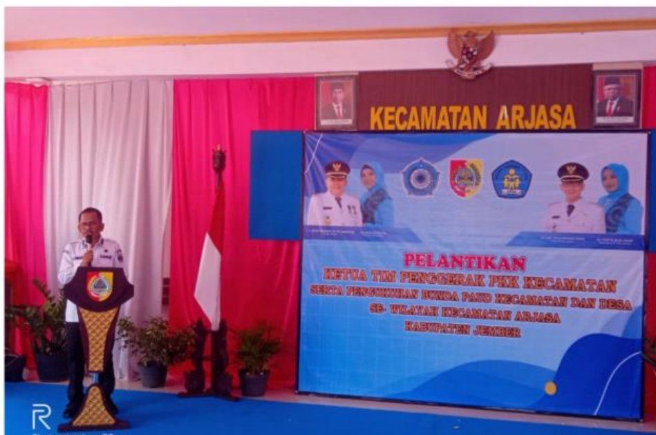
Foto Kegiatan PKK Kecamatan Arjasa