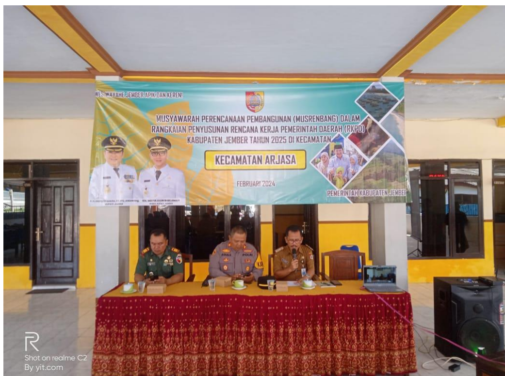
Foto Kegiatan Musrenbang Kecamatan Arjasa