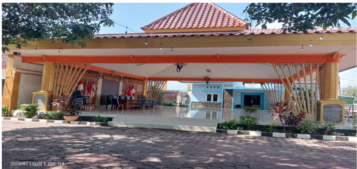
Foto Pengecatan Kantor Kecamatan. Arjasa