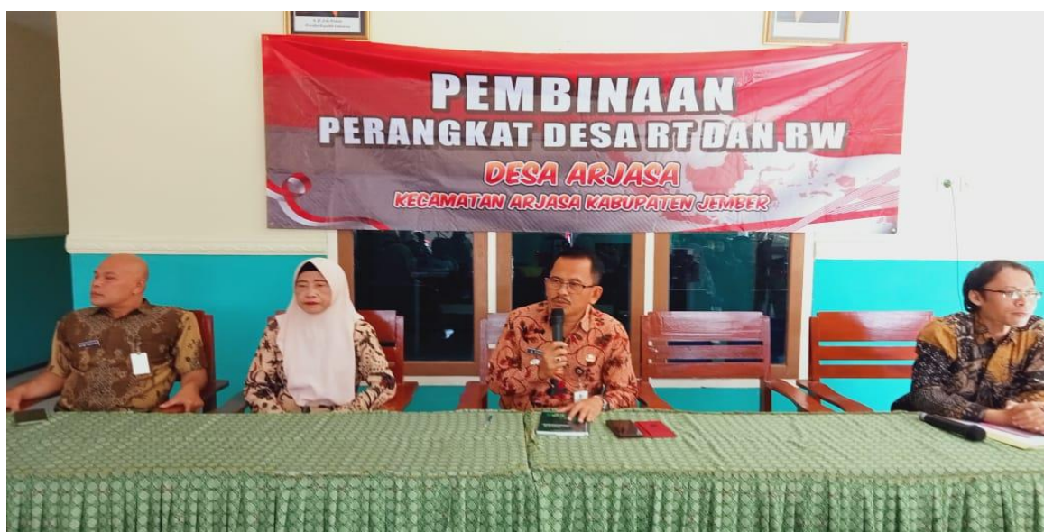
Foto Pembinaan RT dan RW Kecamatan Arjasa