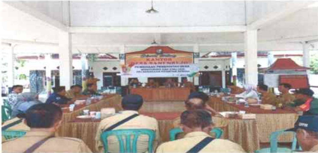
Pelatihan dan Pembinaan Perangkat Desa

Pembinaan Pemerintahan Desa Monitoring dan Evaluasi Pelaksanaan Kegiatan APBDes Tahun 2024