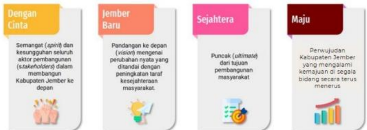
Gambar 2.1 Pokok Visi Pembangunan Jangka Menengah Kabupaten Jember Tahun 2025-2029

Sumber: Rancangan Awal RPJMD Kab. Jember Tahun 2025-2029