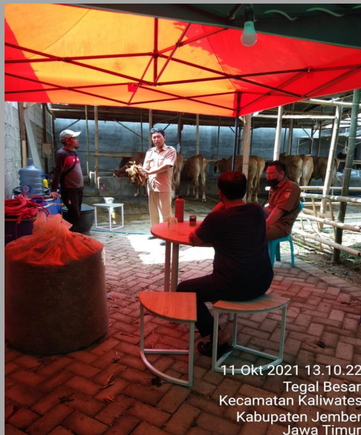
11 Okt 2021 13.10.22 Tegal Besar Kecamatan Kaliwates Kabupaten Jember Jawa Timur