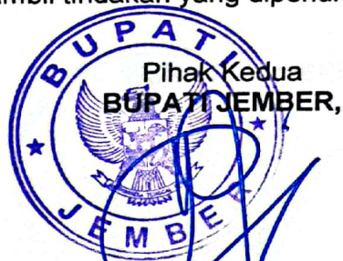
Ir. H. HENDY SISWANTO, ST, IPU

Pihak kedua akan memberikan supervisi yang diperlukan serta akan melakukan evaluasi terhadap capaian kinerja dari perjanjian ini dan mengambil tindakan yang diperlukan dalam rangka pemberian penghargaan dan sanksi.