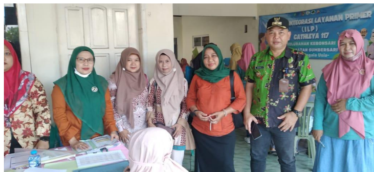
Foto Kegiatan ( Kapling ) Kegiatan jemput bola untuk percepatan adminduk dengan sasaran balita yang belum mempunyai NIK di Posyandu Kelurahan Kebonsari dan Sekolah Dasar