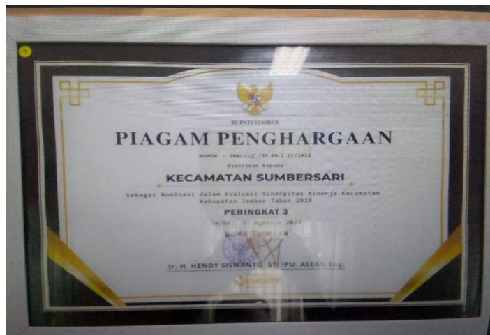
Foto Penghargaan Evaluasi Kecamatan Tahun 2024

Kecamatan Summersari melaksanakan pelayanan administrasi terpadu atau yang sering disingkat dengan PATEN merupakan suatu penyelenggaraan pelayanan publik di Kecamatan dimana dalam proses pengelolaannya mulai dari Permohonan sampai ke tahap terbitnya dokumen dilakukan dalam satu loket atau meja pelayanan ( diruang Pelayanan Umum ), Prosentase pelayanan PATEN yang sesuai dengan SOP telah memenuhi target dengan realisasi sebesar 93,95% .