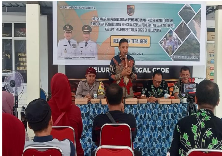
Musrembang ditingkat Kecamatan