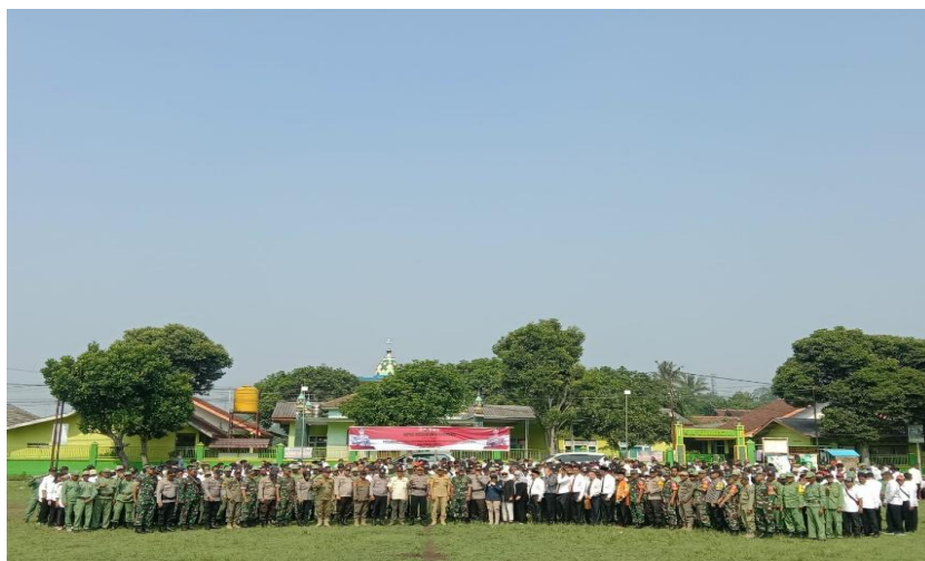
Foto Apel Kegiatan Pemilu Tahun 2024