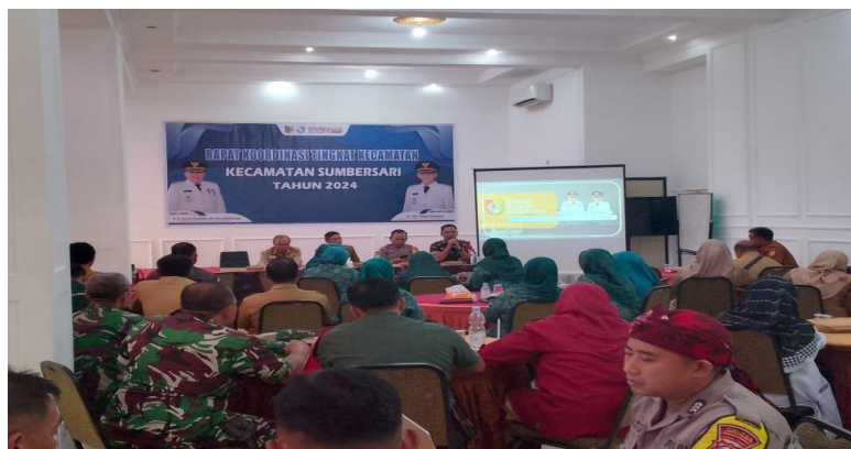
Foto Kegiatan Rapat Koordinasi Tingkat Kecamatan