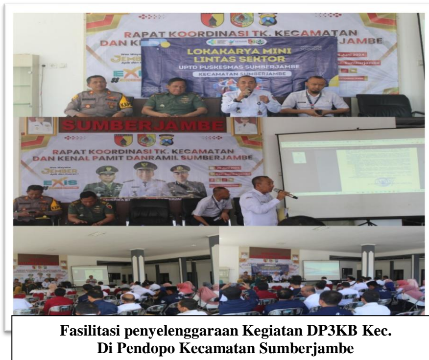
Fasilitasi penyelenggaraan Kegiatan DP3KB Kec. Di Pendopo Kecamatan Sumberjambe

Tujuan dari kegiatan-kegiatan tersebut adalah meningkatkan akses kesehatan masyarakat dan percepatan penurunan angka Stunting di Kecamatan Sumberjambe.