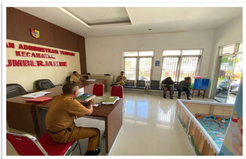
Ruangan Pelayanan Publik yang Nyaman Ber-AC dengan Spot Taman Bermain Anak dan Ruang Laktasi

Tujuan dari penyiapan ruangan Pelayanan Publik yang nyaman dengan sarana prasarana lengkap diharapkan masyarakat sambil menunggu penyelesaian dokumen yang dibutuhkan.