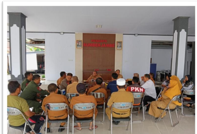
Rapat Staf Membahas Kinerja Pegawai khususnya ASN dan Monev tentang Capaian Kinerja SKPD