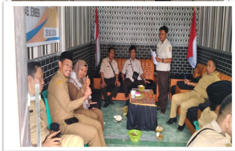
Rapat Internal/Staf Membahas Kinerja Pegawai Kecamatan di Pendopo dan Ruang Rapat Kec. Sumberjambe

Tujuan Rapat Internal/Staf yaitu membahas tentang pelaksanaan Tupoksi pegawai yang harus dilaksanakan dan atasan langsung wajib monev terhadap bawahan dalam pelaksanaan tugasnya. Diharapkan semakin tinggi capaian kinerja individu pegawai mempengaruhi dalam capaian kinerja SKPD.