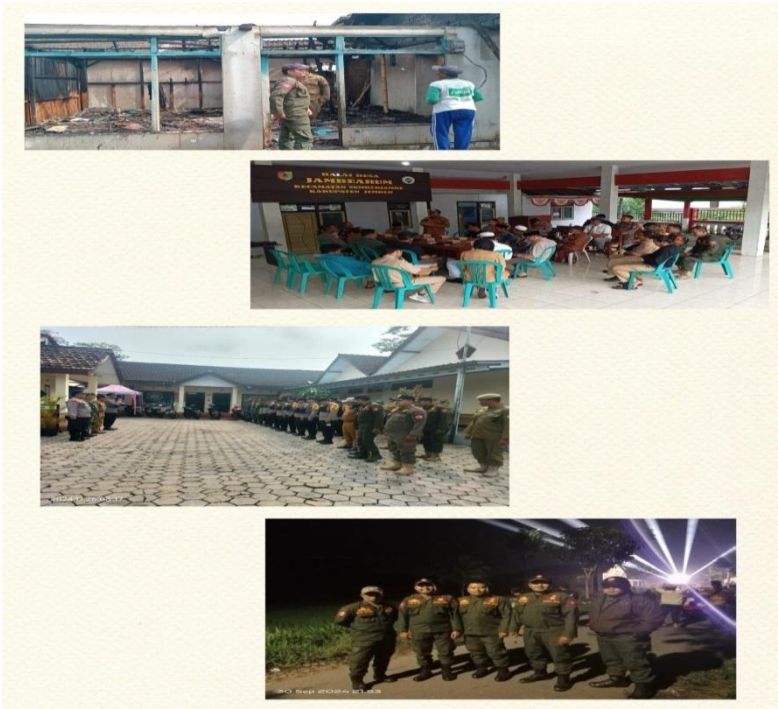
Kegiatan Pengamanan dalam menjaga ketentraman dan ketertiban Umum