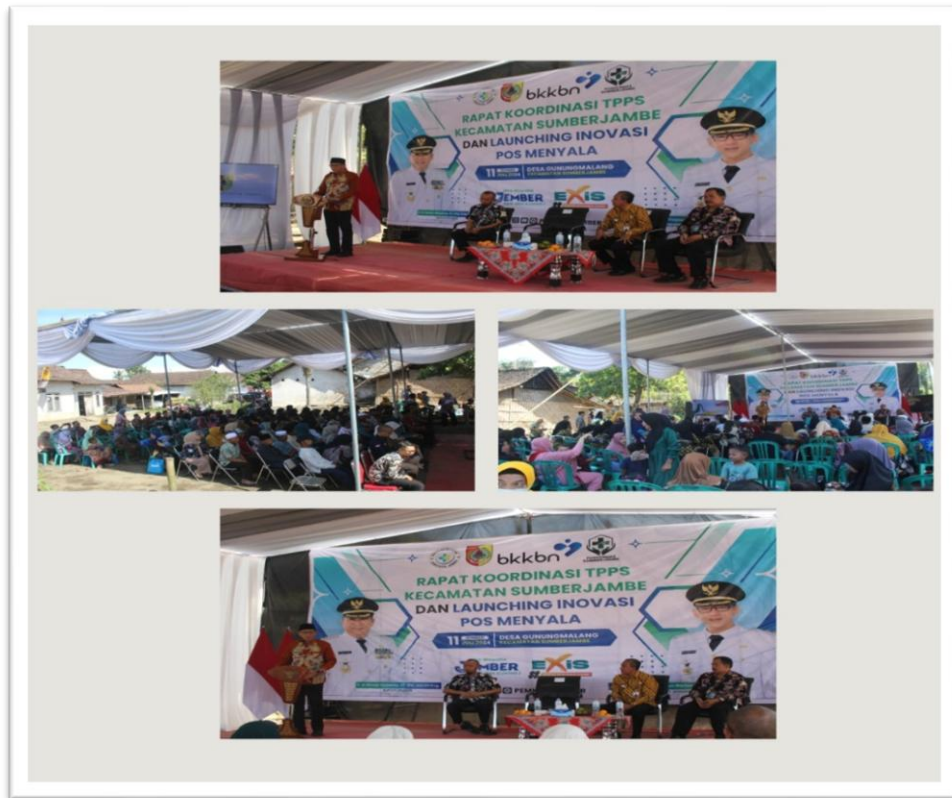
Fasilitasi penyelenggaraan Minilokarya Puskesmas di Pendopo Kecamatan Sumberjambe