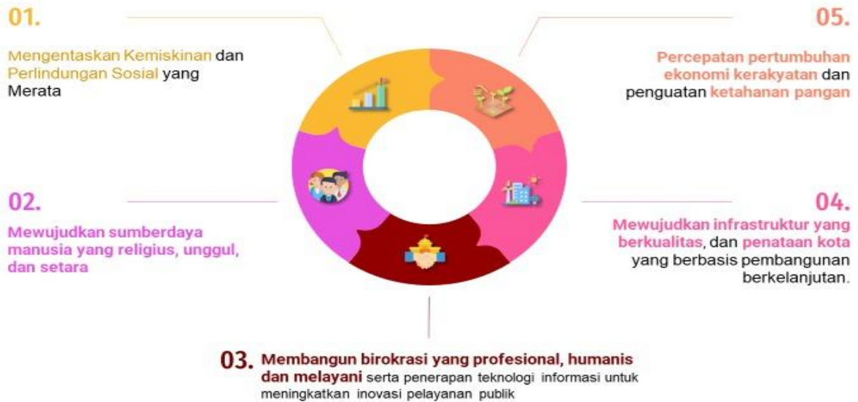
Gambar 2.2 Misi Pembangunan Jangka Menengah Kabupaten Jember Tahun 2025-2029

Sumber: Rancangan Awal RPJMD Kab. Jember Tahun 2025-2029