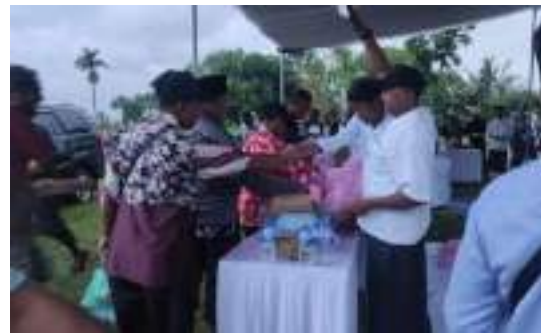
Fasilitasi Pemerintah Desa dalam Pemanfaatan Teknologi Tepat Guna