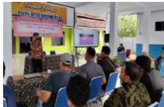
Fasilitasi Pengembangan Usaha Ekonomi Masyarakat dan Pemerintah Desa dalam Meningkatkan Pendapatan Asli Desa