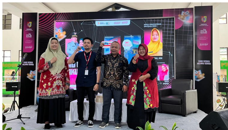
Temu Bisnis Pelaku Usaha

b. Faktor penghambat ketercapaian program adalah