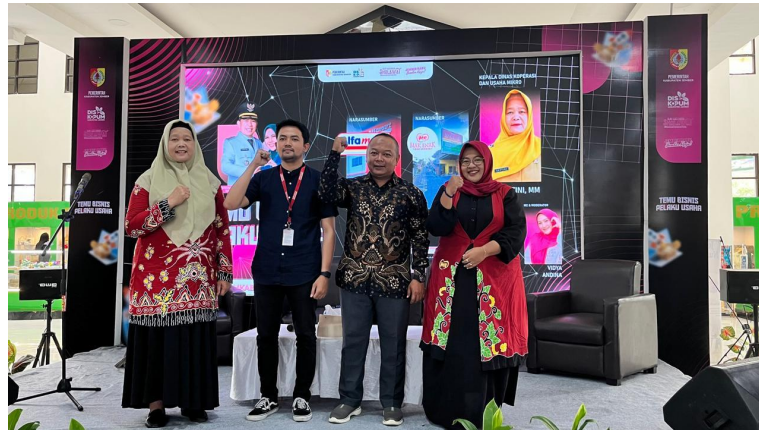
Temu Bisnis Pelaku Usaha