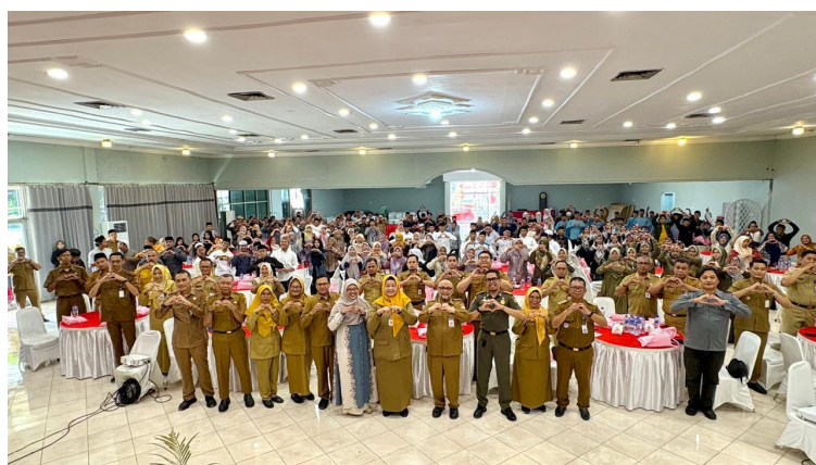
Talkshow Hari Santri 2025