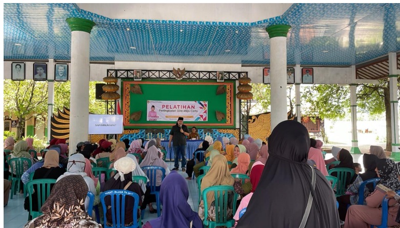
Pelatihan Peningkatan SDM Mlijo Cinta