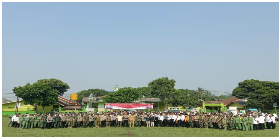
Foto Apel Bersama

Sub kegiatan Koordinasi/Sinergi dengan Perangkat Daerah yang Tugas dan Fungsinya di Bidang Penegakan Peraturan Perundang-Undangan dan/atau Kepolisian Negara Republik Indonesia belum terealisasi (0%) karena masih lemahnya komunikasi awal, belum adanya kesepakatan jadwal pelaksanaan kegiatan dan keterbatasan dukungan teknis. Tindak lanjut yang akan di lakukan adalah dengan inisiasi pertemuan lintas instansi, penyusunan rencana aksi bersama, dan penguatan dukungan administratif serta anggaran pendukung.