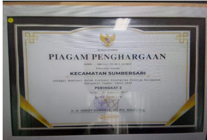
Foto Penghargaan Evaluasi Kecamatan Tahun 2024