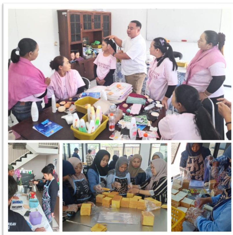
Kegiatan Pelatihan Kompetensi - Program Pelatihan Kerja Dan Produktivitas Tenaga Kerja