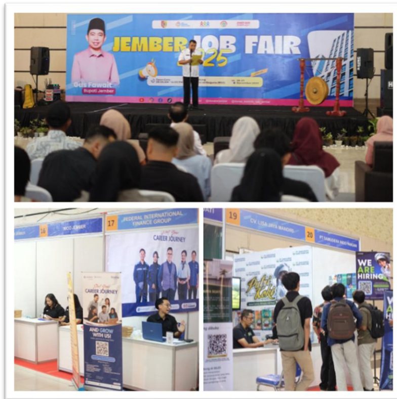
Kegiatan Job Fair 2025 - Program Penempatan Tenaga Kerja