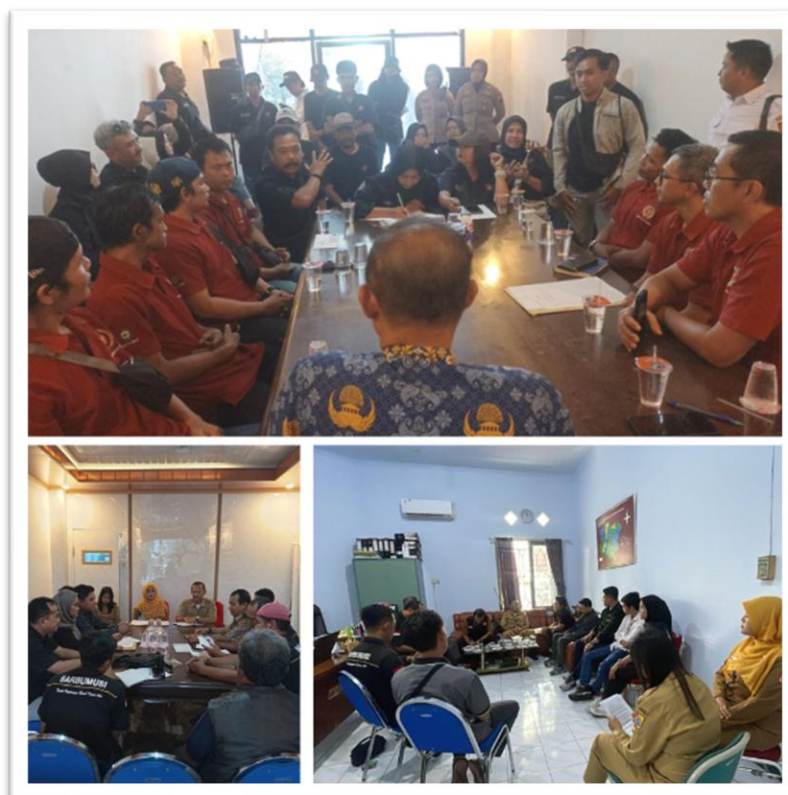
Kegiatan Mediasi Penyelesaian Kasus Perselisihan Hubungan Industrial - Program Hubungan Industrial