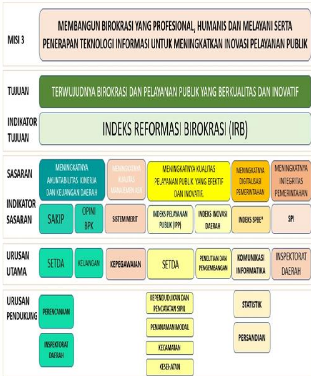
Gambar 2 Cascading Kabupaten Jember