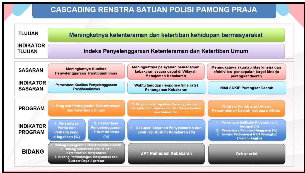
Gambar 3.2 Cascading Satuan Polisi Pamong Praja Kabupaten Jember