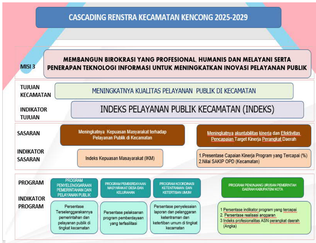
Gambar 3.2 Cascading Kecamatan Kencong Kabupaten Jember