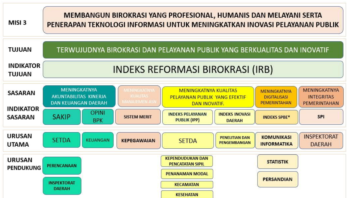
Gambar 3.1 Cascading Kabupaten Jember (MISI 3)