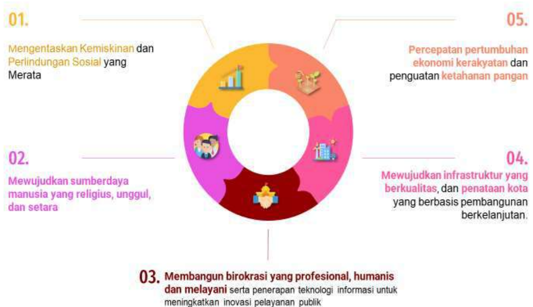
Gambar 2.1 Misi RPJMD Kabupaten Jember 2025-2029

Dari lima misi tersebut, yang menjadi kewenangan sesuai dengan tupoksi Sekretariat Daerah Kabupaten Jember adalah terkait pada Misi ke- 3 yaitu; Membangun birokrasi yang profesional, humanis dan melayani serta penerapan teknologi informasi untuk meningkatkan inovasi pelayanan publik