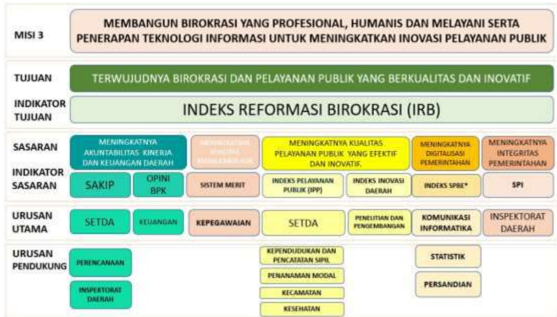
Gambar 2.2 Logical Framework Misi 3 RPJMD 2025-2029

Berdasarkan logical Framework Misi 3, tujuan pada RPJMD yang akan didukung oleh Sekretariat daerah sesuai dengan tugas dan fungsinya adalah Terwujudnya birokrasi dan pelayanan publik yang berkualitas dan inovatif. dengan sasaran RPJMD :