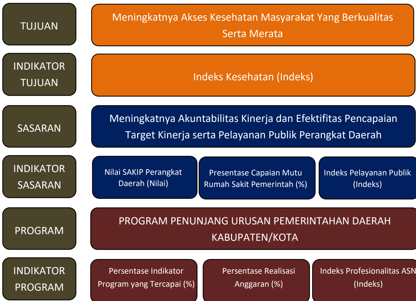
Gambar 3.1 Cascading RSD Balung Kabupaten Jember