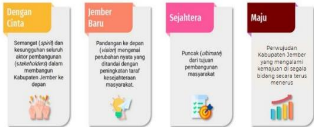
Gambar 2.1 Pokok Visi Pembangunan Jangka Menengah Kabupaten Jember Tahun 2025-2029

Sumber: RPJMD Kab. Jember Tahun 2025-2029