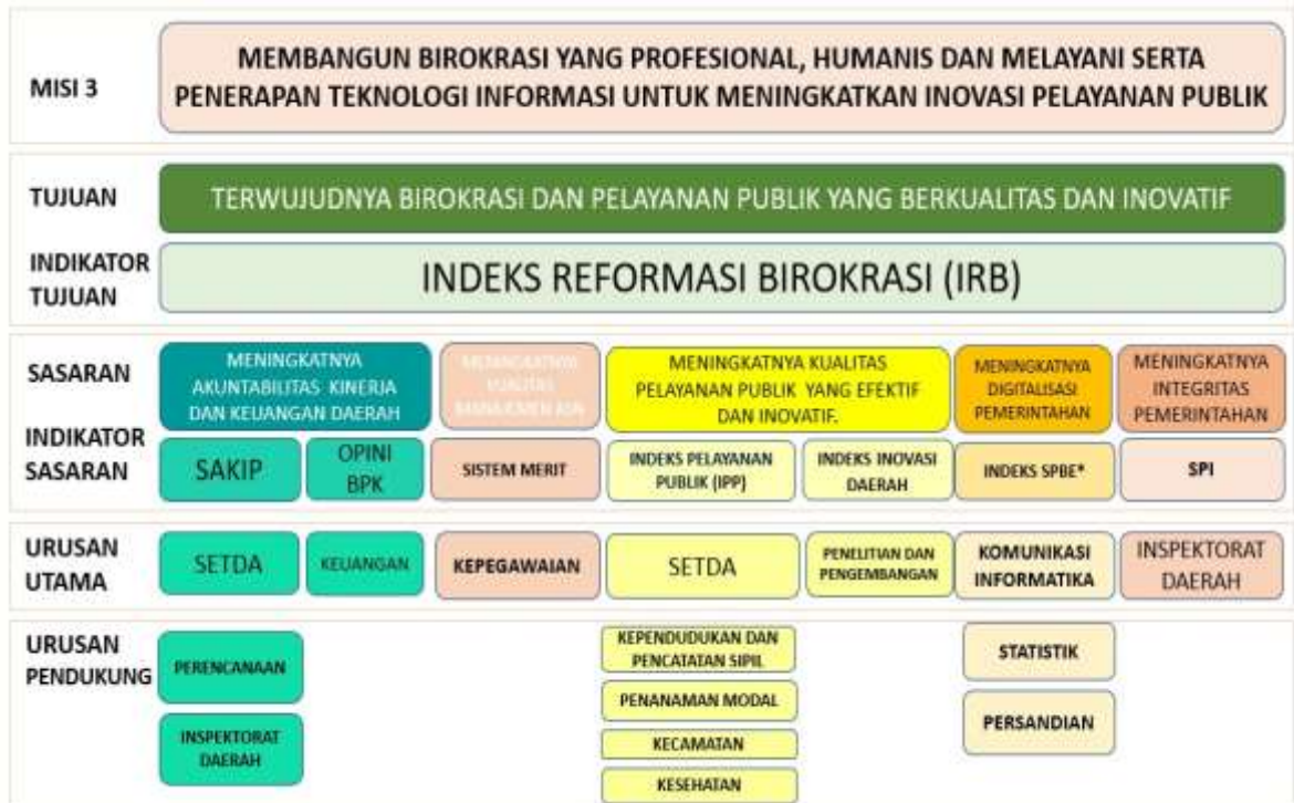
Gambar 3.2 Cascading Kecamatan Gumukmas Kabupaten Jember