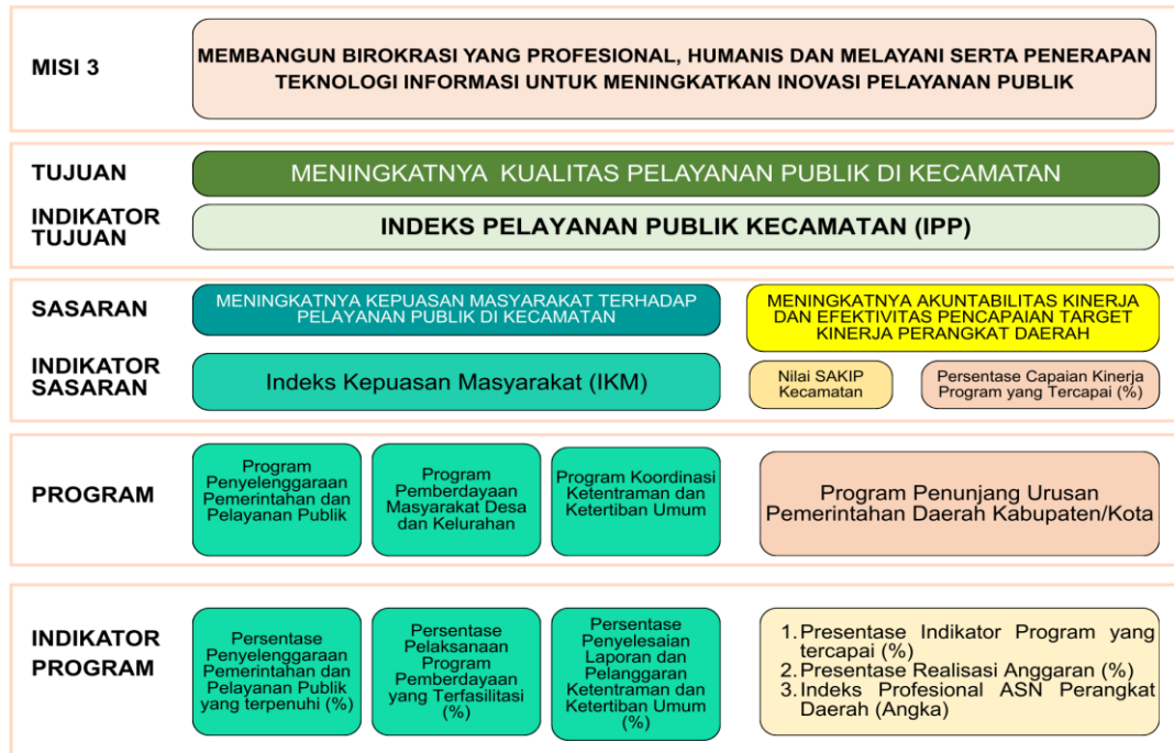
Gambar 3.1 Cascading Kecamatan Semboro Kabupaten Jember